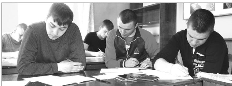
Во время анкетирования предстояло отвечать на самые неожиданные вопросы, которых было около сотни.