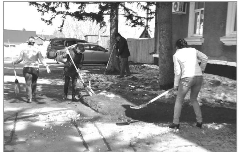
Глава района не раз говорил подчиненным: «Начинать надо с себя». Начали: на прошлой неделе коллектив администрации района, а также работники ведомств, которые занимают соседнее административное здание, вышли на субботник. Убрали мусор, разворовали снег, подмели и почистили территорию.

— Все остановки в райцентре будут приведены в надлежащий вид. Павильоны, находящиеся возле каких-либо организаций или торговых точек, покрасят их работники. Один из них — у вокзала — обновил предприниматель, возле детской поликлиники работали представители Молодежной думы, на «Школьной» покрасят студенты техникума. Некоторые организации сами приобретут краску, а для остальных спонсорскую помощь ока-