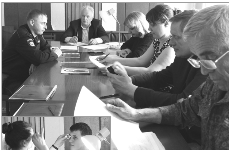
Призывной комиссии предстоит досконально изучить дело каждого призывника, прежде чем вынести решение о готовности к службе.