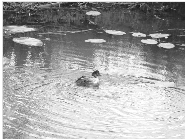
Домашнюю птицу не следует отпускать в открытые водоемы.

Корма для птиц хранить в местах, недоступных для воробьев, галок, голубей и пр. Установить на подворьях пугала, трешотки и дру-