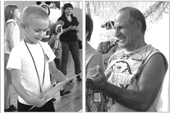
На фото: эмоции переполняли участников спортивных конкурсов и всех, кто пришел их поддержать.

ДЕНЬ ФИЗКУЛЬТУРНИКА объединил множество любителей здорового и активного образа жизни, а также болельщиков — как говорится, от пионеров до пенсионеров. Взрослые соревновались во многих видах спорта, а воспитанники детских садов участвовали в «Веселых стартах», конкурсах и эстафетах.