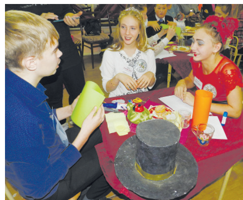
Команда «Королевское время» из Загайновской школы была, пожалуй, самой артистичной.

«Вкусный чай! Хорошая организация праздника. Королевы — просто красави-