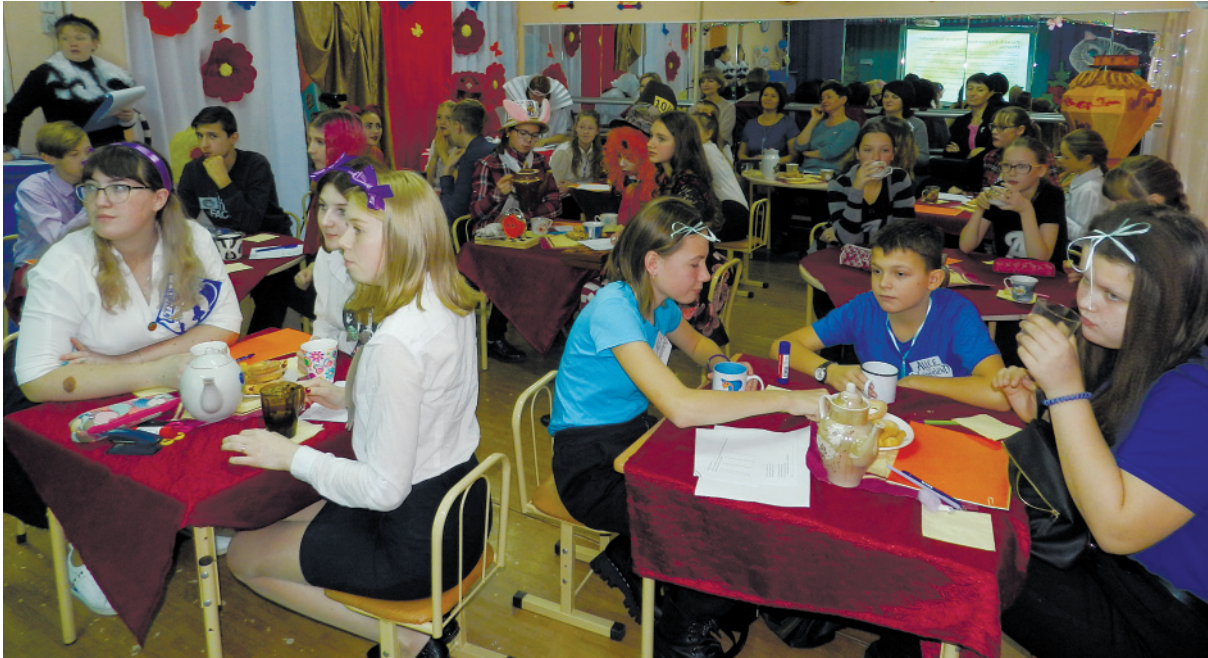
«Безумное чаепитие» в ДЮЦ в самом разгаре.

Игра состояла из шести раундов, первым из которых, как и полагается, стало представление команд. Второй раунд носил название «Правда или нет?». Командам предлагались тезисы, связанные, конечно же, с создателем «Алисы» и его знаменитыми произведениями. Заодно этот раунд стал проверкой домашнего задания. Ведь тема игры была озвучена игрокам заранее, и у них была возможность подготовиться к интеллектуальному испытанию. Но даже те, кто не использовал эту возможность в полной мере до начала игры, уже по ходу узнали много нового и интересного. Оказывается, имя Алиса входит в десятку самых популярных имен в России. Но, вопреки одной из