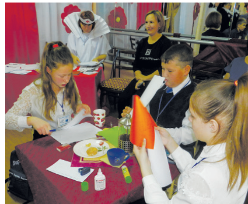
За выполнением творческого задания — команды Ельцовской (фото слева) и Троицкой №1 школ.