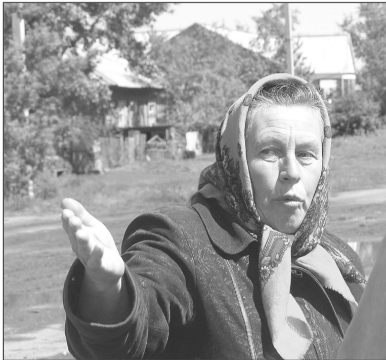
В Красноярах люди жаловались, что тополя могут стать причиной гибели и травматизма людей.

Чистый и аккуратный внутри Ереминский дом досуга снаружи