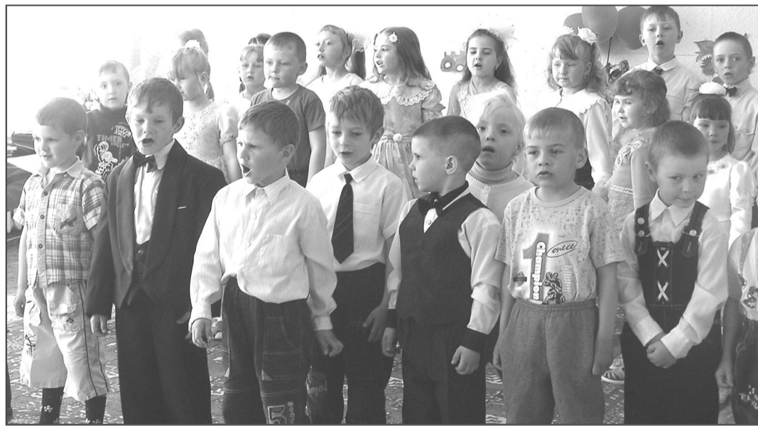
В Красноярском детсаду для шестерых выпускников устроили праздничные проводы.