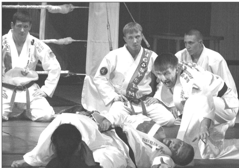
Эффектные броски бойцов джиу-джитсу.