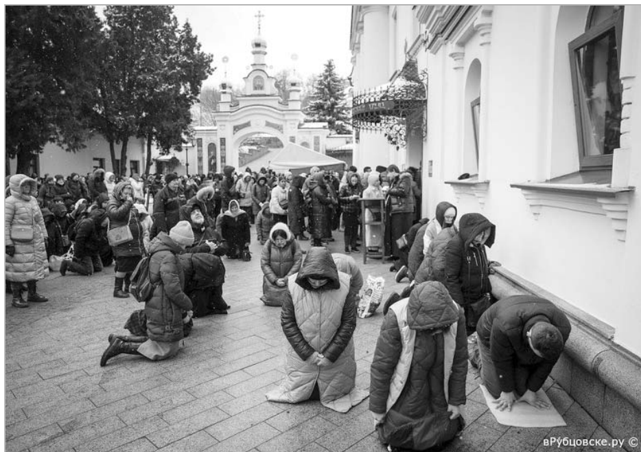
На Украине раскольники и радикалы массово захватывают храмы канонической Украинской православной церкви Московского патриархата. Истинно верующие как могут защищают свои церкви, молятся и в храмах, и на улице. Они верят, что правда и Бог на их стороне и храмы будут возвращены истинной церкви.

Из «Повести временных лет» известно, что князь Олег в Киев пришел из Новгорода и только по истечении многих лет назвал Киев «матерью городов русских».