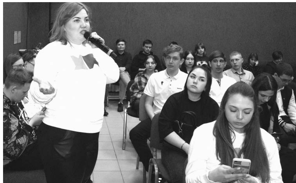
На выездном заседании Молодежного правительства Алтайского края школьники и студенты смогли задать волнующие их вопросы и получить ответы от парламентариев и представителей администрации района.