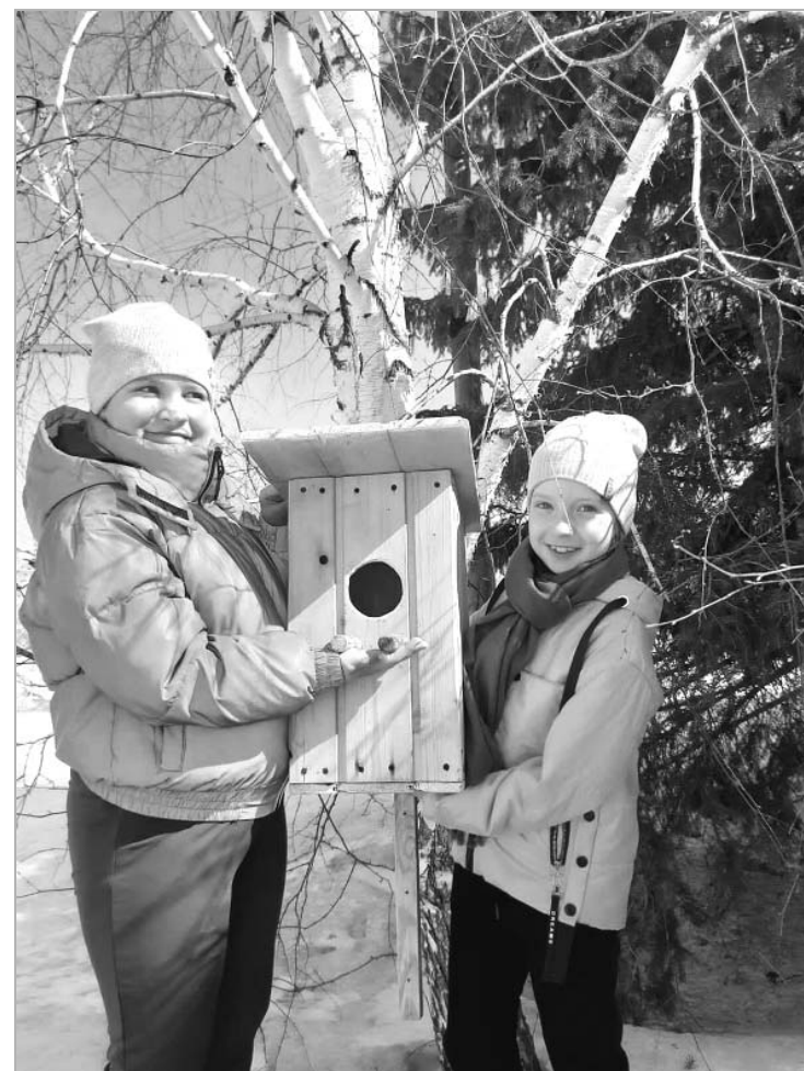
К встрече с пернатыми хайрюзовские ребята подготовились основательно.

Ну, а планы... В ближайших планах у семьи посадка огорода и разведение живности, благо для этого есть хозяйственные постройки.