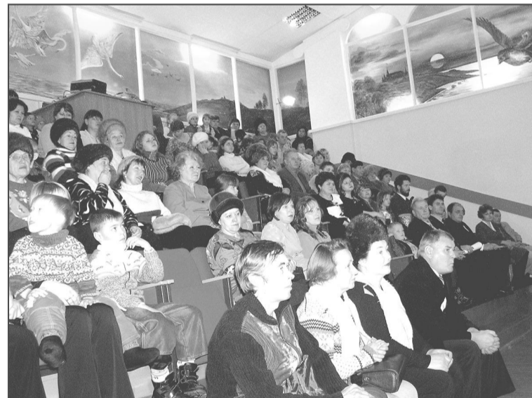
Концертный зал ДШИ такой знакомый и одновременно неузнаваемый...

Наталья ТРОФИМОВА.