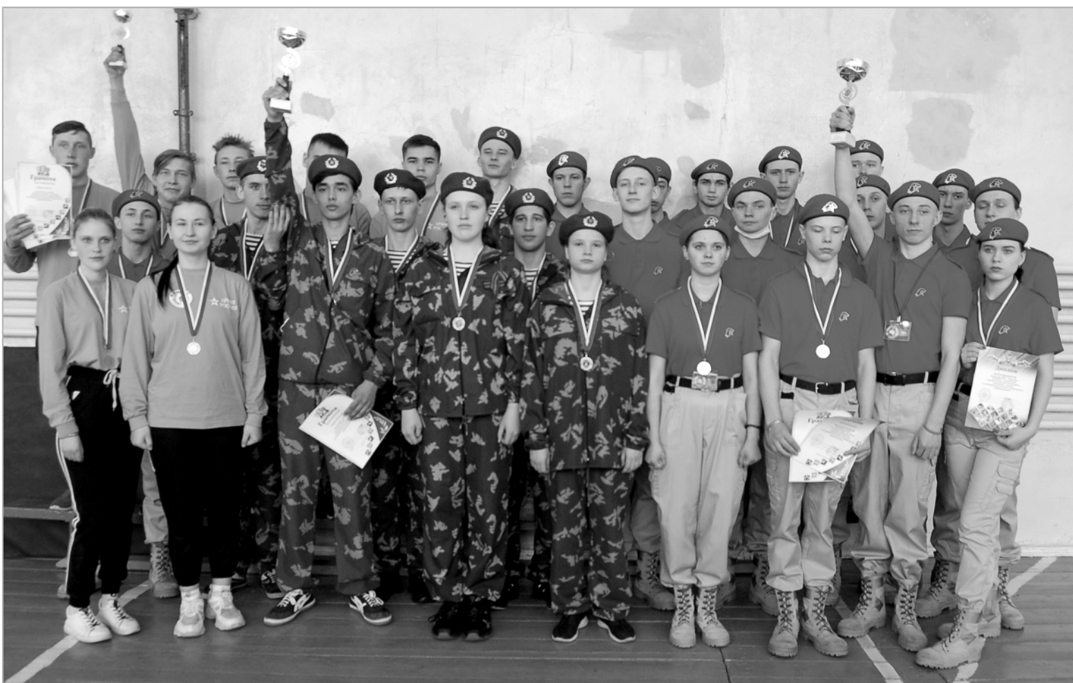
Участники военно-спортивных соревнований (слева направо): косихинские, троицкие и техникумовские.