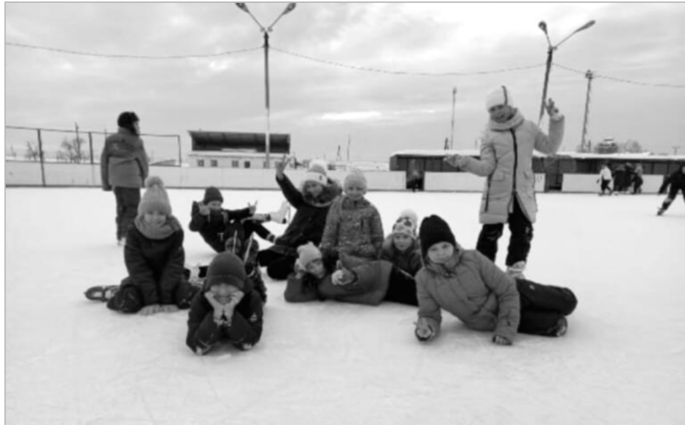
Танцевальный коллектив «Модерн».