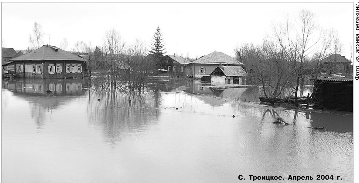
С. Троицкое. Апрель 2004 г.