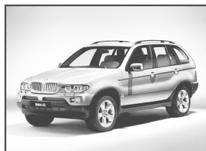
BMW - 5X

«Бэха» – отличная тачка. У меня уже третья такую угоняют – это о чем-то говорит!