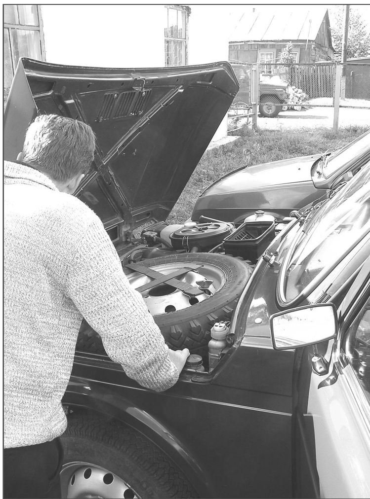
Если долго мучиться, что-нибудь получится!.. Поэтому не выбирайте автомобиль самостоятельно, если не разбираетесь в технике.

можно определить, осмотрев поверхность кузова. Блики света обычно идут прямолинейно, а в месте деформации прерываются или уходят по дуге. На крыше автомобиля блики должны образовывать развернутый веер, искривления его лучше говорить о том, что машина переворачивалась или на нее что-то роняли. Зазоры между дверями и косяками должны быть одинаковыми, различие между ними – свидетельство деформации металла. На это же стоит обратить внимание при осмотре крышек багажника и капота. Усевшись в водительское кресло, приложите усилие к рулевому колесу. При ДТП сильный удар оставляет трещины на руле, заметные при сильном надавливании.