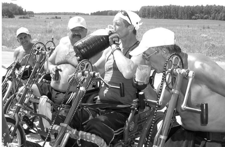
Помимо традиционного хлеба с солью гостей встречали холодным квасом: самое то в знойный денек!

Тот, кто видел спортсменов-инвалидов и общался с ними, не может не восхищаться их мужеством – шутка ли, преодолеть сотни километров по изнуряющей жаре! Вот почему их гостеприимно встречали на троицкой земле. Мероприятие по встрече организовало управление по социальной поддержке населения администрации района с участием местного общества инвалидов. Прямо на трассе