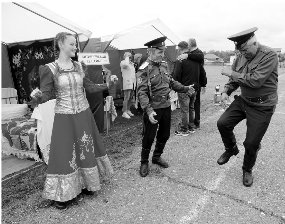
Ансамбль казачьей песни из Петропавловского района.