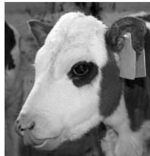
На правах рекламы.

Управление ветеринарии по Троицкому району.