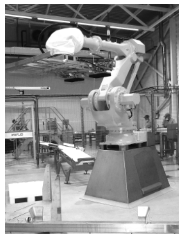
Электрические погрузчики перевозят сырные головки, но особое впечатление производит первый в нашем районе промышленный робот, предназначенный для укладки сыра в контейнеры.

В заводских цехах – стерильная чистота, сродни чистоте хирургической операционной. Чтобы войти в цех, нужно обработать руки, надеть халат, шапочку и бахилы. В каждом помещении сырохранилища при помощи приборов климатической установки поддерживаются оптимальная влажность и температура для разных сортов сыра и этапов выдержки. Если влажность будет меньше нормы, то сыр усохнет, а если больше – то может заплесневеть. Даже дерево для поддо-