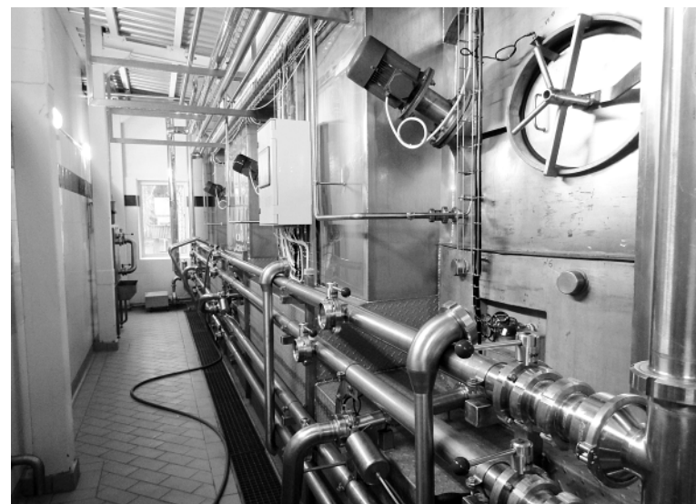
Множество расположенных повсюду, и даже под потолком, трубопроводов различных диаметров из нержавеющей стали поражает воображение.

пищевого клея. Эту операцию, кстати, производят 12 раз.