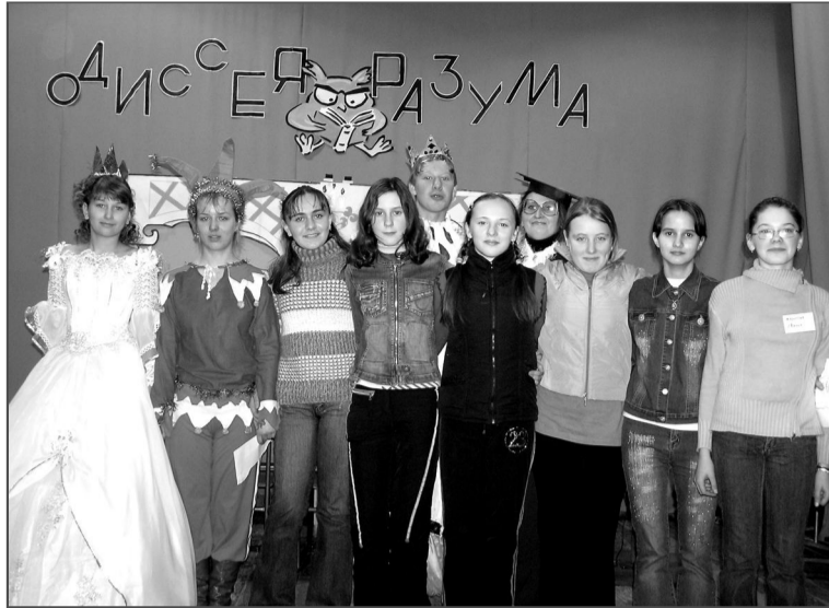
Вся королевская рать и команда-победительница – интеллектуалы Зеленополянкой средней школы

Дума протест принимает и дает дополнительный одиннадцатый вопрос. Впрочем, ребята из Большеереченской неполной школы это не смутило, и они все равно вошли в тройку финалистов.