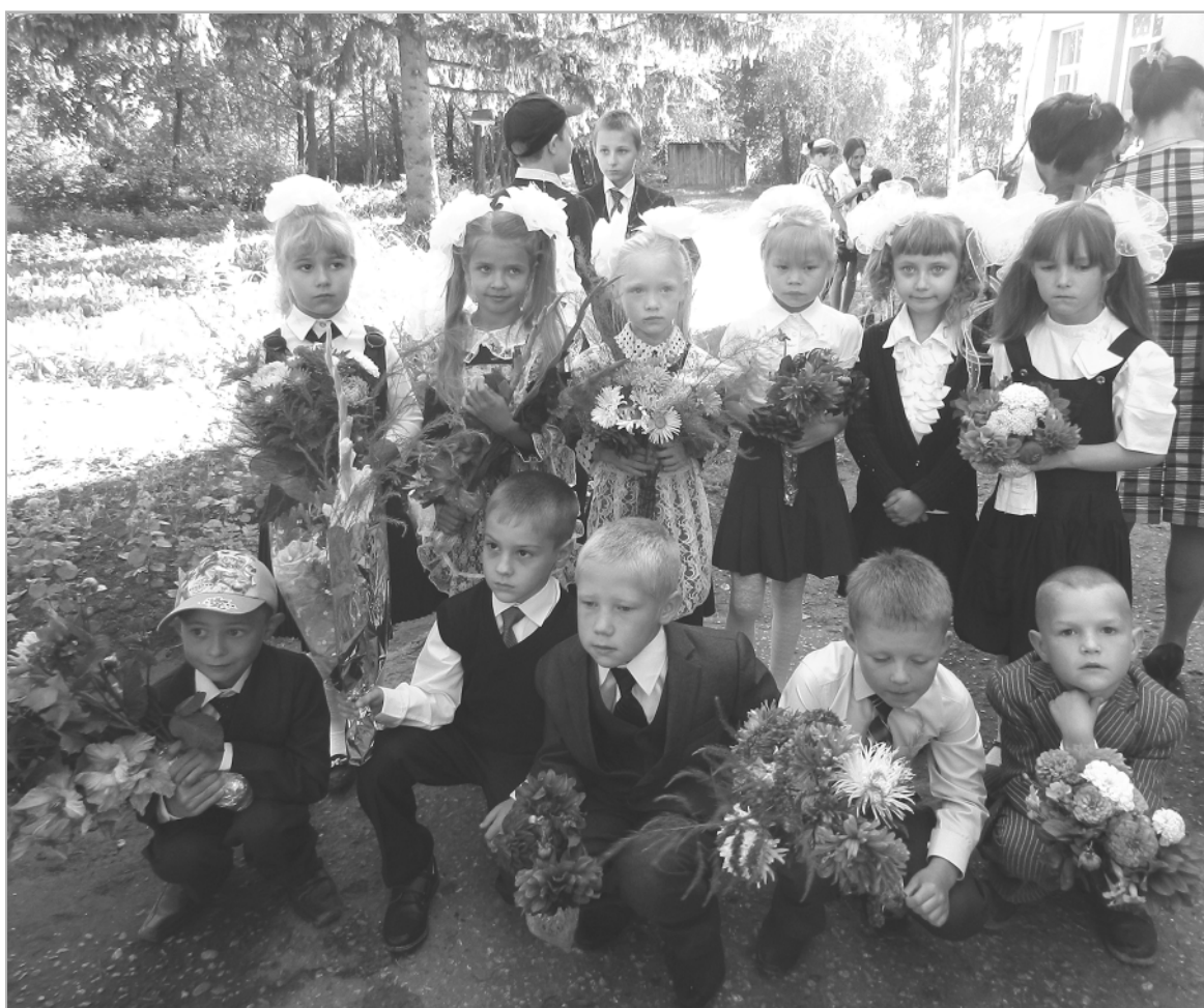
Нынешние первоклассники Пролетарской школы пока еще не знают, что ждет их в будущей школьной жизни, но уже осознают всю ответственность наступившего момента.

— В нашей школе более 700 учеников. Когда начинается перемена, учителя стоят вдоль стен, пока по коридору движется поток учащихся. Возникли проблемы с орга-