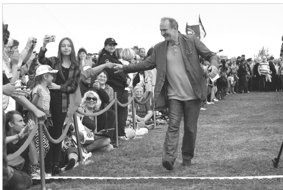
Публика тепло встречала гостей Шукшинского кинофестиваля, среди которых был популярный актер театра и кино Федор Добронравов.