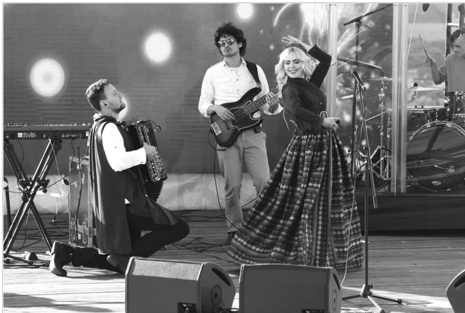
Программу Шукшинских дней на Алтае завершило яркое выступление Пелагеи.