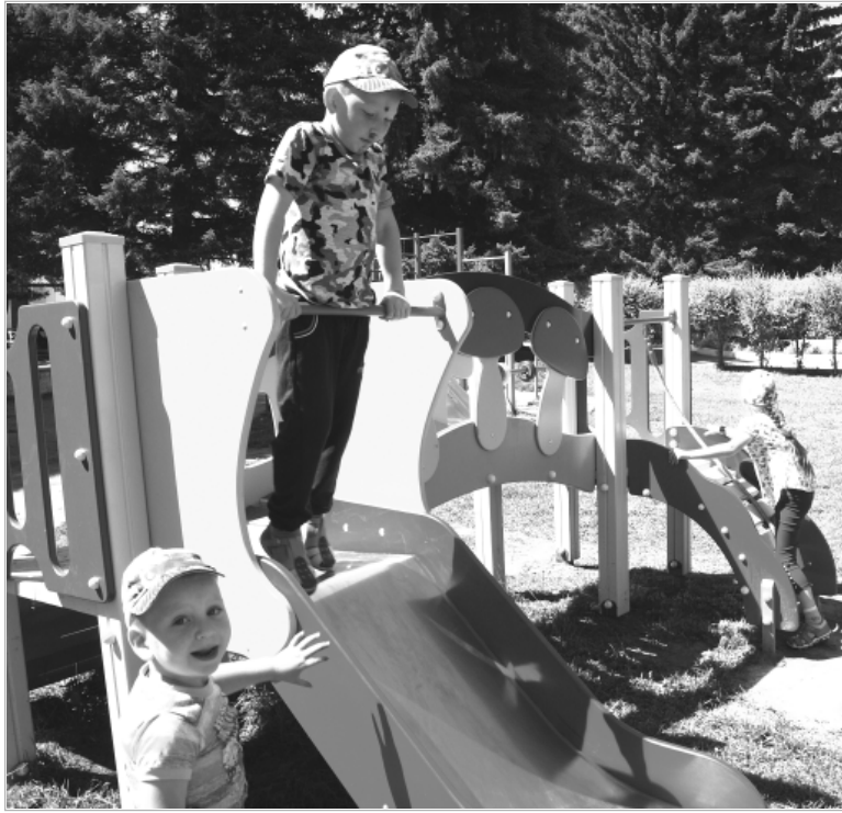
На детской площадке в центральном сквере с. Троицкого.