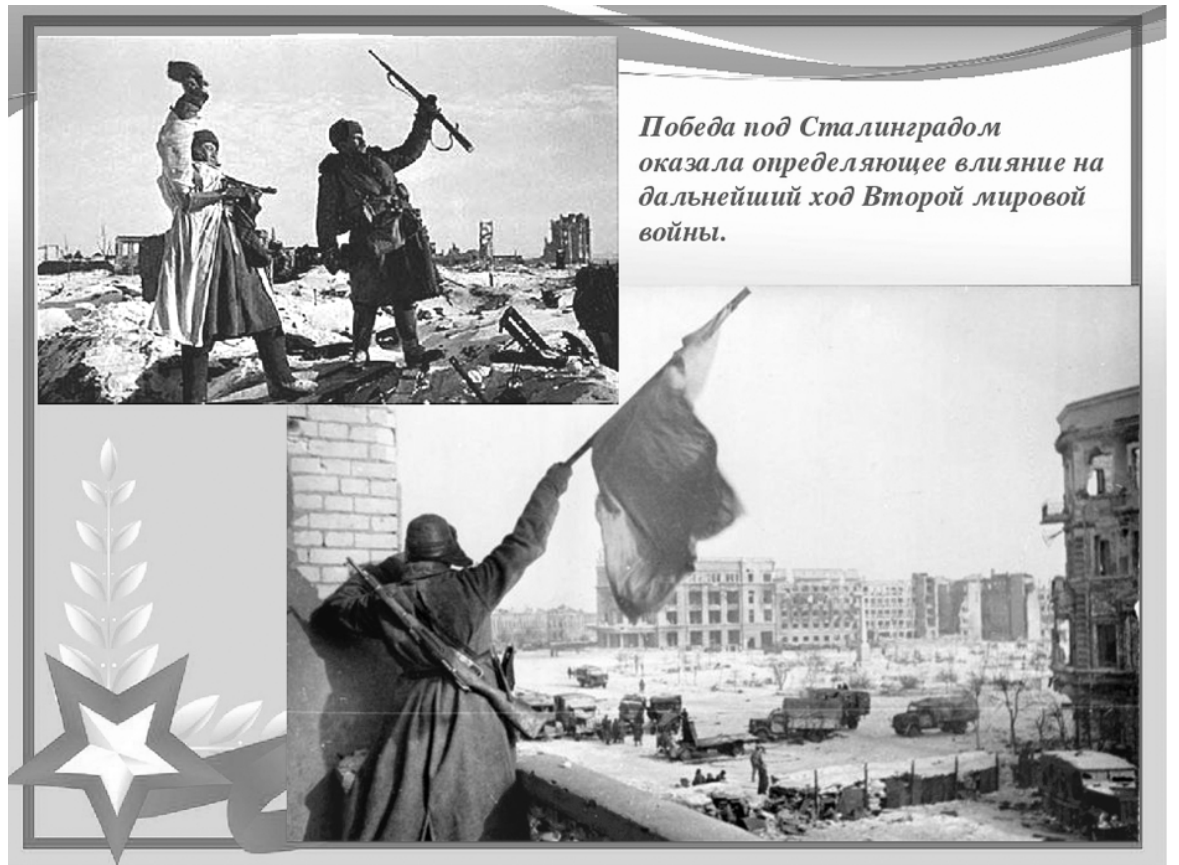
Победа под Сталинградом оказала определяющее влияние на дальнейший ход Второй мировой войны.

Ответы принимаются с 26 января по 2 февраля включительно по e-mail: troickbiblioteka@mail.ru или по адресу: ул. Пушкина, 11, Троицкая модельная библиотека.