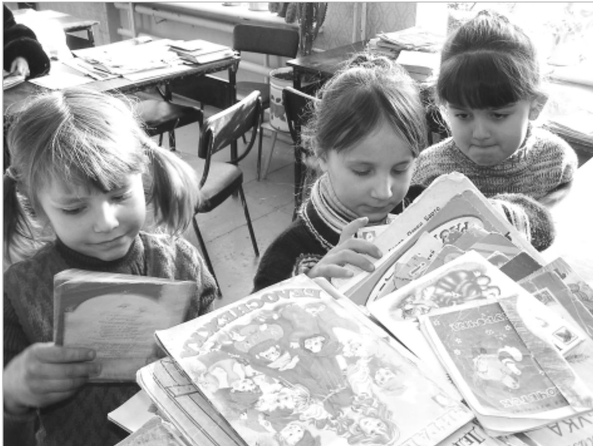
(снимок сделан в 2006 г.).

Выйдешь на улицу — бабульки на лавочке тебе и оценку поставят, и комментарий добавят, и статус вслед крикнут.