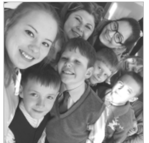
28-29 января проходили встречи лидеров молодежного движения Санкт-Петербурга с учащимися и педагогами Боровлянской школы, во время которых гости презентовали свои новые проекты: «Символы российского патриотизма» и «Мое письмо в столетие Победы». Общение хозяев школы и ее гостей проходило в непринужденной дружеской обстановке и вызвало массу положительных эмоций.