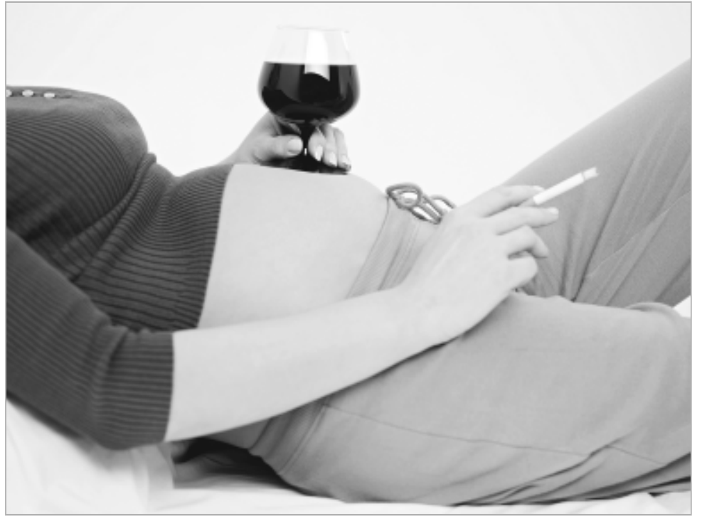
При таком образе жизни будущая мама заранее обрекает своего малыша на болезнь...

Огромное значение придается борьбе с абортными, которые по-прежнему имеют место быть, хоть и не в таких больших количествах, как еще несколько лет назад. Свою роль играет просвещение в плане контрацепции, немало и тех, кого удалось просто отговорить от этого шага. Существует множество способов контрацепции, чтобы избежать нежелательной беременности. Вся необходимую информацию можно получить у акушера-гинеколога. Но, несмотря на доступную информацию о контрацепции, женщи-