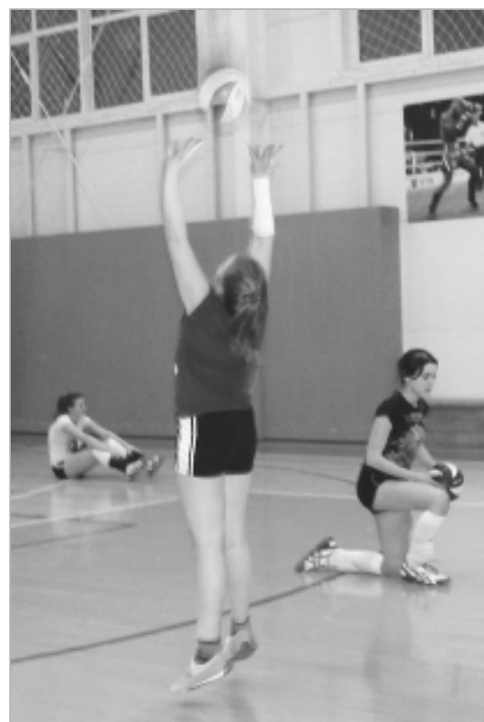
На тренировке по волейболу без разминки не обойтись.