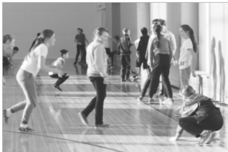
25 января на первый урок физкультуры в новый спорткомплекс пришли учащиеся 5 «в» класса ТШ №2.

Тем временем на первом этаже произошла «смена декораций», и футбольное поле по мановению руки В.В. Попова превратилось в волейбольную площадку, на которую под звуки бодрой музыки выбежали девочки в разноцветных футболках и начали разминку, включающую в себя самые разнообразные упражнения. Только после того, как девочки основательно размялись, тренер выкатил на площадку около дюжины ярких мячей, и его подопечные начали отработать различные приемы