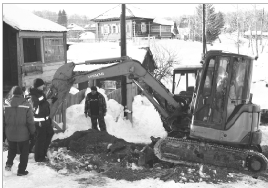
Сейчас домовладельцам надобно постараться не упустить возможность выполнения земляных работ, чтобы установить стояк.

Напомним, в районцентре в рамках федеральной целевой программы «Устойчивое развитие сельских территорий» продолжается строительство двух объектов газификации. Это ГРП-17 (3,75 километра, 105 квартир от реки до переулка Лермонтова по улицам Чапаева, Лесной, проезду Западному, переулкам Чкалова и Социалистическому) и ГРП-18 (3,66 километра, 126 квартир на улицах Чернышевского и М. Горького от переулка Лермонтова до леса и часть переулка Больничного и Титова).