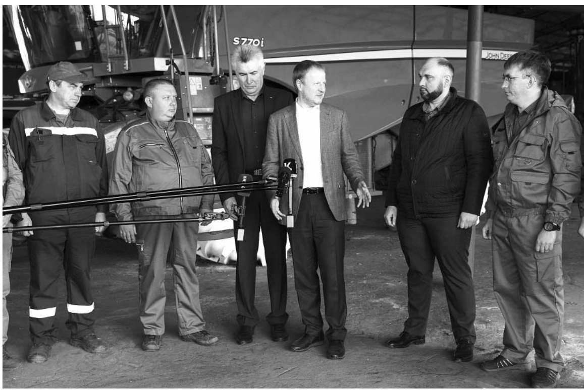
На встрече с земледельцами Мамонтовского района.

Глава региона также отметил еще один вопрос — участие Алтайского края в новом сухопутном зерновом коридоре между Россией и Китаем: «Владимир Путин поручил Правительству РФ разработать соответствующее соглашение. Изучаем перспективы и возможности этого проекта для нашего края».