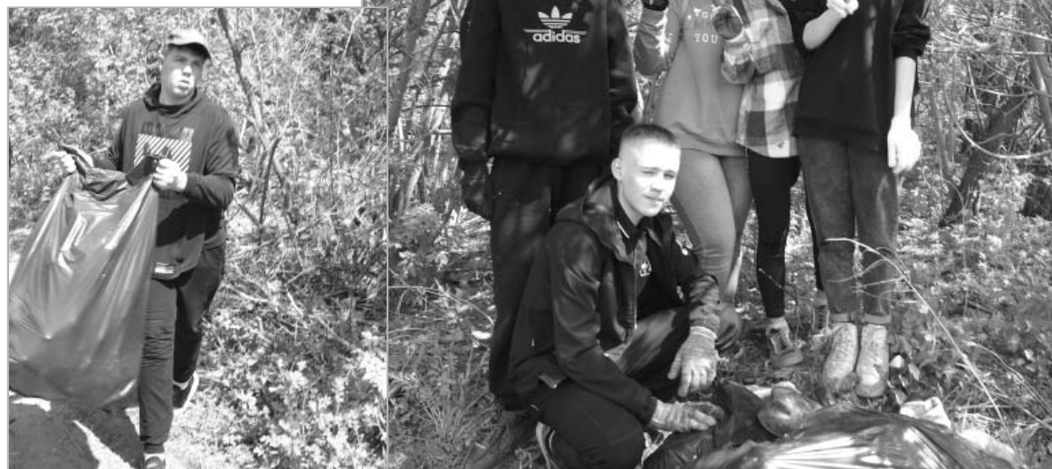
Студенты 1 курса Алтайского агротехнического техникума – в числе участников акции.

24 мая в селе Троицком прошло ежегодное, ставшее уже традиционным, мероприятие, когда волонтеры убирают мусор по берегам Большой речки. Организатором акции выступает администрация района.