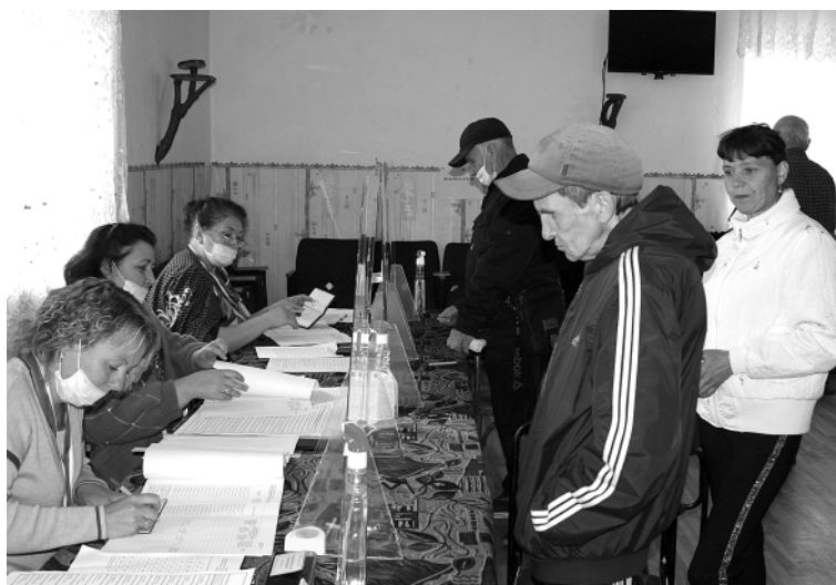
В Зеленой Поляне с утра на участке голосования образовались очереди из избирателей.