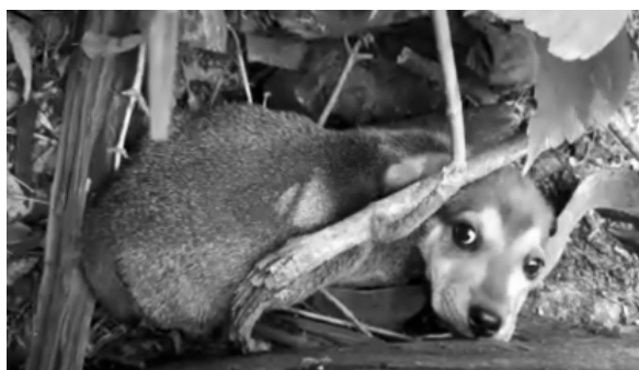
Щенок, которого равнодушные жители райцентра извлекли из мусорного контейнера, пока еще не верит в свое чудесное спасение.

С наступлением осени так называемые «хозяева» кошек и собак, словно сговорившись, избавляются от приплода своих домашних питомцев (порою вместе с самими питомцами): подкидывают в общественные места, увозят подальше в лес или просто выбрасывают в мусорные контейнеры. Недавно в райцентре произошел просто ужасающий случай: женщина, двигаясь в дневное время на автомобиле по улице Октябрьской, на ходу выбросила кошку на проезжую часть в районе автобусной остановки «Вокзал» и уехала. Надо отдать должное водителям проезжающих машин — они лавировали, как могли, чтобы не задавить несчастное живот-