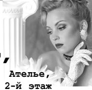
Ателье, 2-й этаж

В день святого Валентина Дарят все букет любимым. В магазине « Ванда » ждут, Свежих вам цветов нарвут.