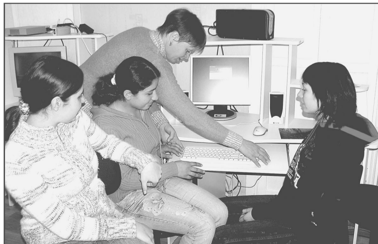
Компьютерный класс в Хайрюзовской школе был оборудован благодаря выигранному миллиону рублей. Чисто, светло, уютно. А в колле на переменах можно поиграть в настольный теннис. Еще ребята мечтают о своем автобусе, а учителя – о том, чтобы в классах было побольше учеников.

Наши учителя подготовлены очень хорошо. 50 процентов педагогов коллектива за год повысили квалификацию, нынче двое будут аттестованы. Соответственно, качество знаний учеников значительно повышается.