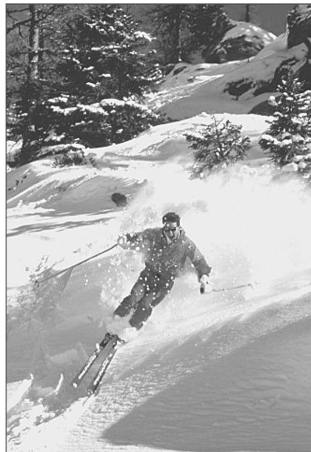
Хотите так же мастерски и красиво съехать по какой-нибудь горной трассе? Начинать с окрестностей Пионерского озера!

–Выселить сейчас газовиков с лыжной базы – это значит поставить крест на газификации района, так как размещать их нигде. К тому же проживают они там не бесплатно, и ДЮСШ имеет от этого неплохие деньги.