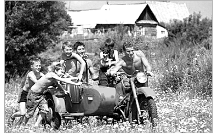
ВНИМАНИЕ: НЕ ПОВТОРЯТЬ — ОПАСНО ДЛЯ ЖИЗНИ!