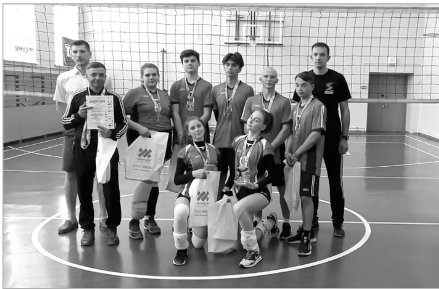
На снимке: команда ТЦШ №2.

21 мая в Барнауле прошли зональные соревнования по волейболу «Школьная волейбольная лига «Пайп». Наш район представляли команды волейболистов из двух школ района. Их соперниками были команды из Павловска и Тальменского района.