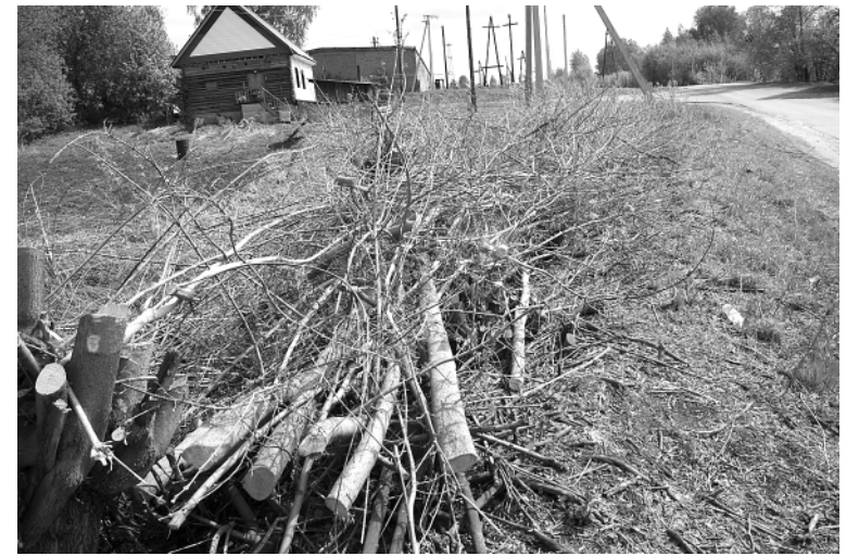
Когда читатели получают газету, этих веток, возможно, здесь уже не будет.

— В ближайших планах — строительство детской спортивной площадки в заречной части села по улице Новоселов по госпрограмме «Комфортная городская среда». Думаю, что к середине лета работа на этом объекте будет завершена. Общая цена строительства — 4 миллиона рублей. Планируем также полностью заменить уличное освещение по улице Ленина от здания Сбербанка до «Макфы», затратив примерно 1 миллион 300 тысяч рублей, так что наша главная улица будет освещена практически полностью. Начали ремонт памятника Ленину на центральной площади, потому что никто, кроме нас, не возьмется за ремонт, правда, по заверению первого секретаря регионального отделения КПрФ Марии Николаевны Прусаковой, партия поучаствует в ремонте памятника, выделив 20 тысяч рублей. Это, конечно, мизер, так