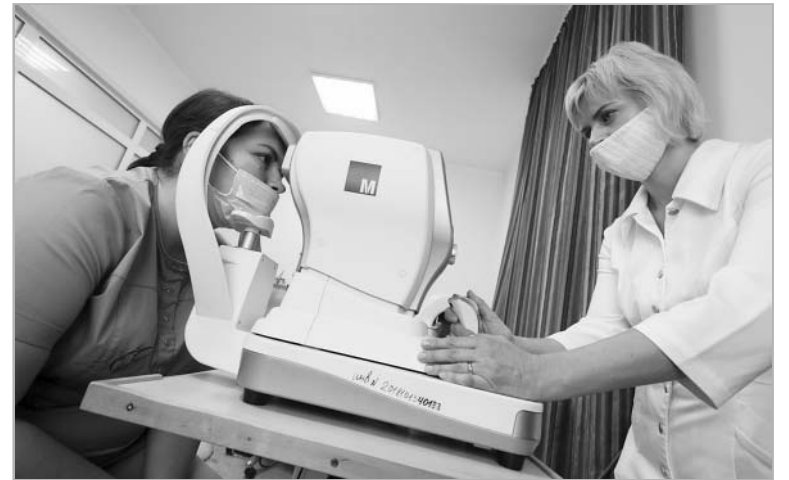
Размещение краевой офтальмологической больницы в современном здании позволит более качественно оказывать услуги, увеличить объем операций с 13 до 18 тысяч.