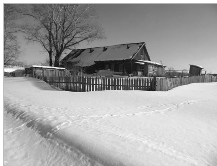
Барак, построенный для лесозаготовителей в 1926 году, был снесен летом 2017-го.