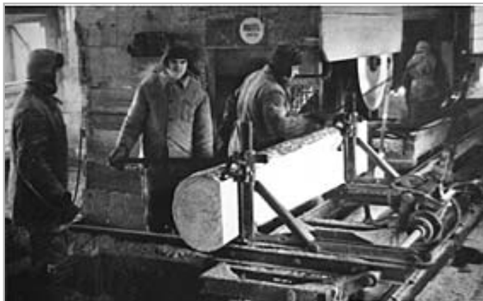
После получения деревообрабатывающих станков. 1930 г.