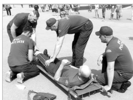
Текст и фото Виктора РЯБОВА.