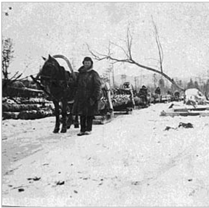
Вывоз леса. 1923 г.