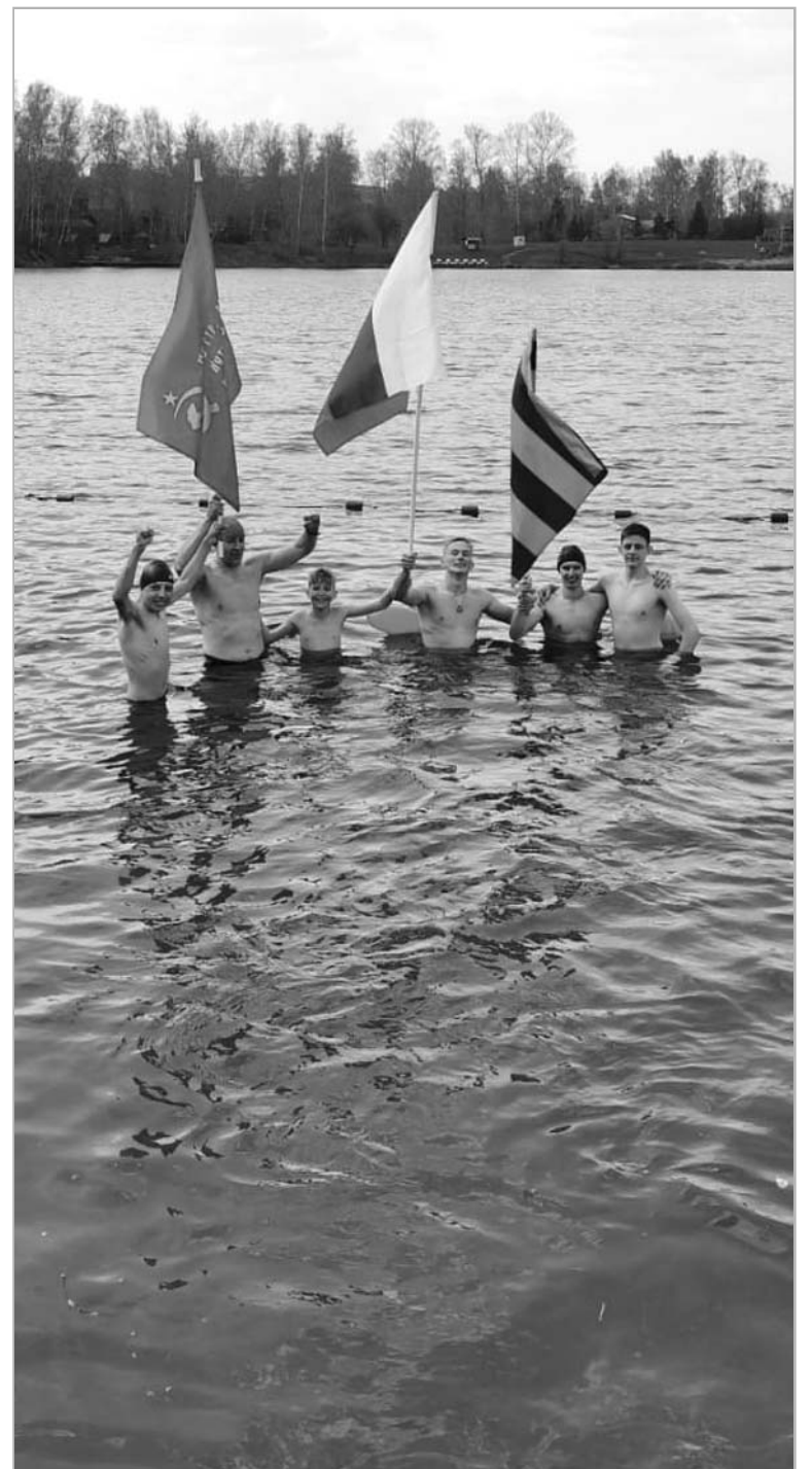
9 мая состоялась заплыв участников патриотического марш-броска на озере Ая, посвященный Дню Победы.