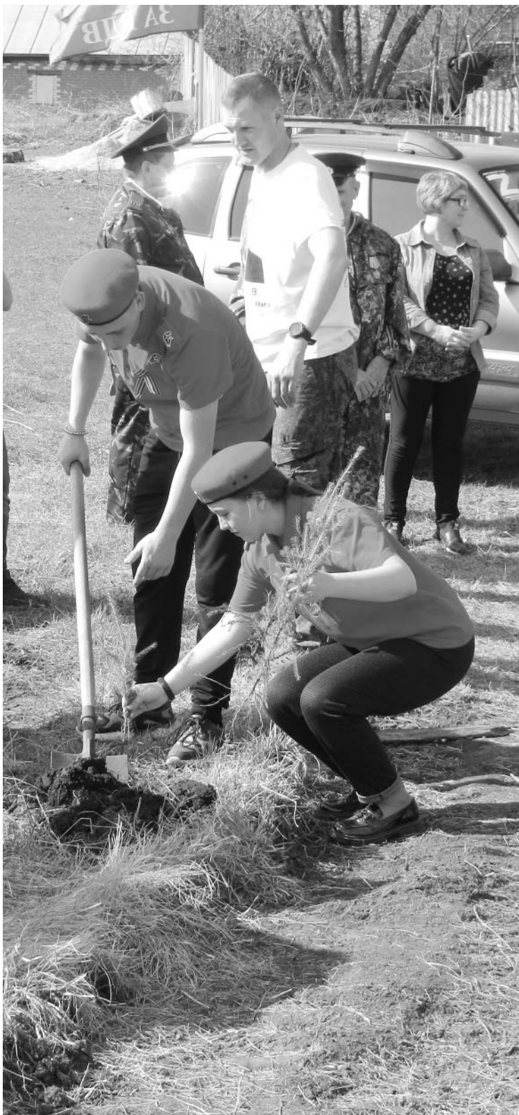
Вместе с ветеранами в посадке принимали участие юнармейцы из военно-патриотического клуба «Ратник».