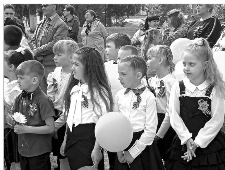
Ученики Беловской школы пришли на митинг, посвященный Дню Победы, с хорошим настроением.