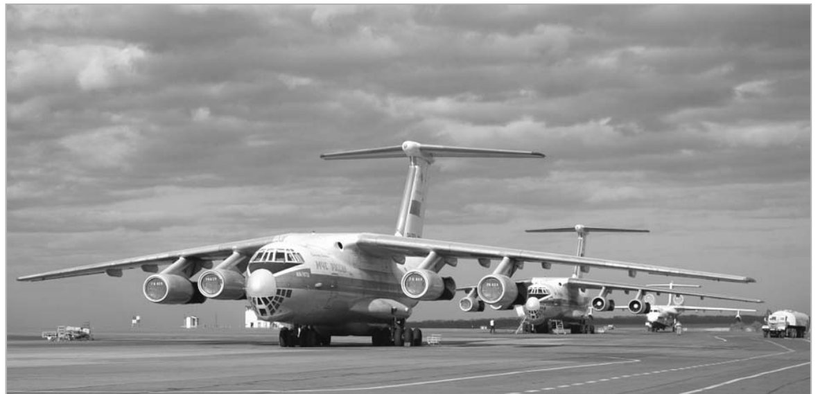
В Барнауле будет построен новый терминал аэропорта, который обойдется в