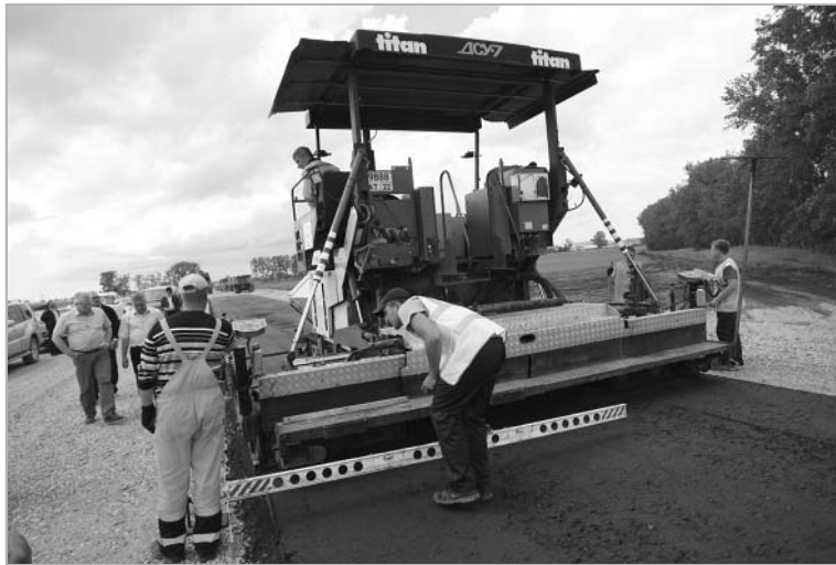
Один из ключевых проектов связан со строительством федеральной трассы А-321, которая соединяет Алтайский край и Казахстан.

Губернатор сообщил, что в соответствии с поручениями президента осуществляется весь комплекс мер, направленных на обеспечение адресного сопровождения всех семей военнослужащих.