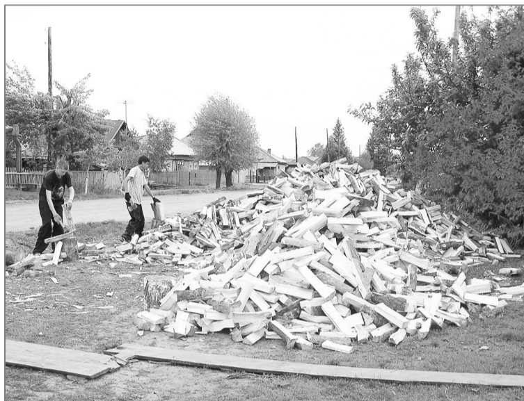
Если раньше с приходом весны на улицах сел появлялись кучи сожнувших дров, то сегодня такая картина – редкость.

На совещании бурно обсуждалась проблема пожаров в лесном фонде. Признали, что это проблема общая, и решать ее надо сообща.