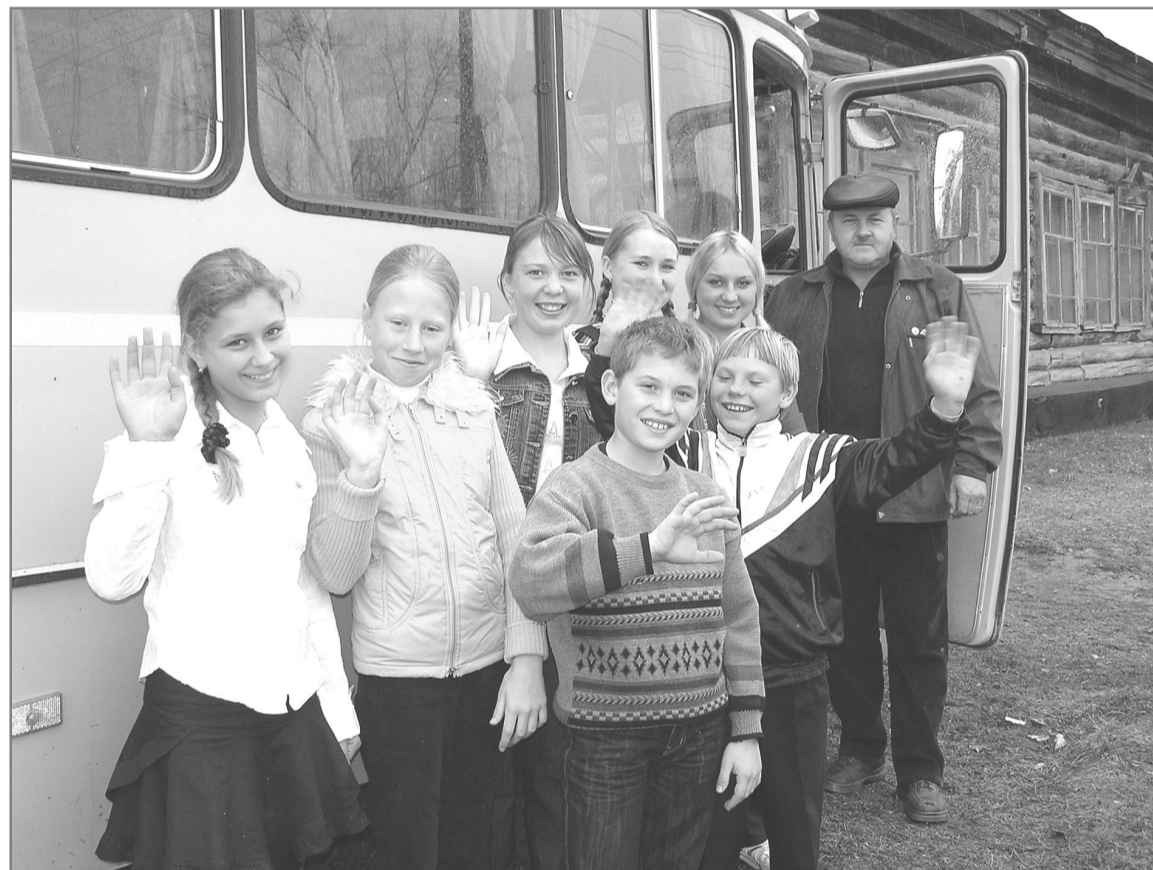
Но приподнятое настроение в эти дни у всех учеников и коллектива Петровской школы – сегодня ей исполняется 80 лет. Этой знаменательной дате посвящен спецвыпуск наших корреспондентов на 4 и 5 стр. номера.

Закончился последний урок, и песьянские ребята дружной ватагой бегут к автобусу – на занятия они приезжают в Петровскую среднюю школу.