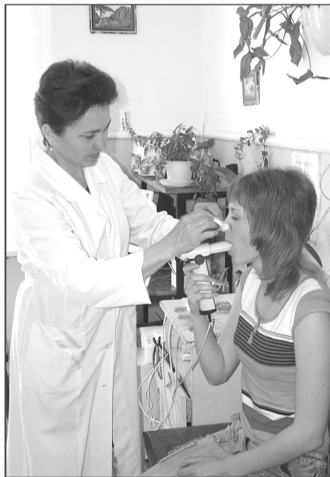
Спирограф, полученный ЦРБ в рамках нацпроекта, позволяет выявлять бронхолегочные заболевания.