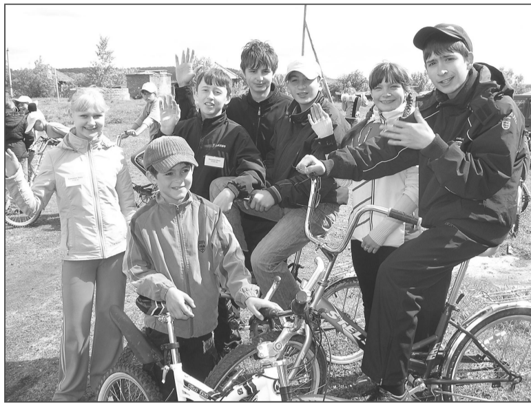
Команда-победительница (Троицкая школа №2).

РЕБЯТАМ ПРЕДСТОЯЛО блеснуть знаниями правил дорожного движения и оказания первой медицинской помощи, продемонстри-