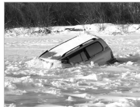
Лед на водоемах сейчас непрочный, и выходить или выезжать на него крайне опасно.