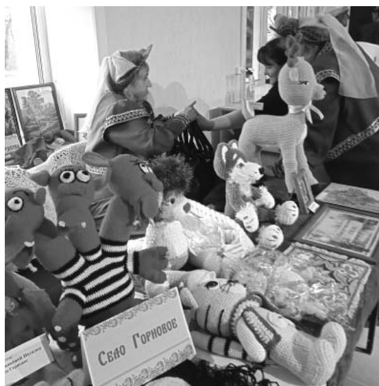
Выставка декоративно-прикладного творчества, по традиции оформленная к празднику в фойе Дома культуры, на этот раз была особенно красочной и многообразной.