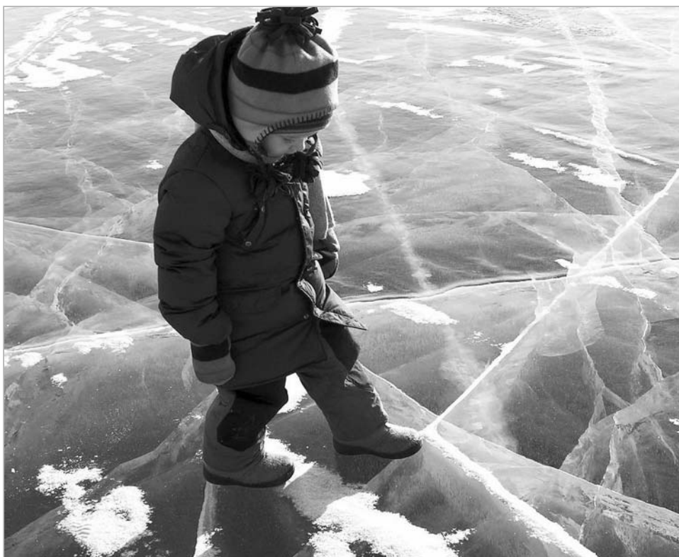
До непоправимой трагедии – один шаг...