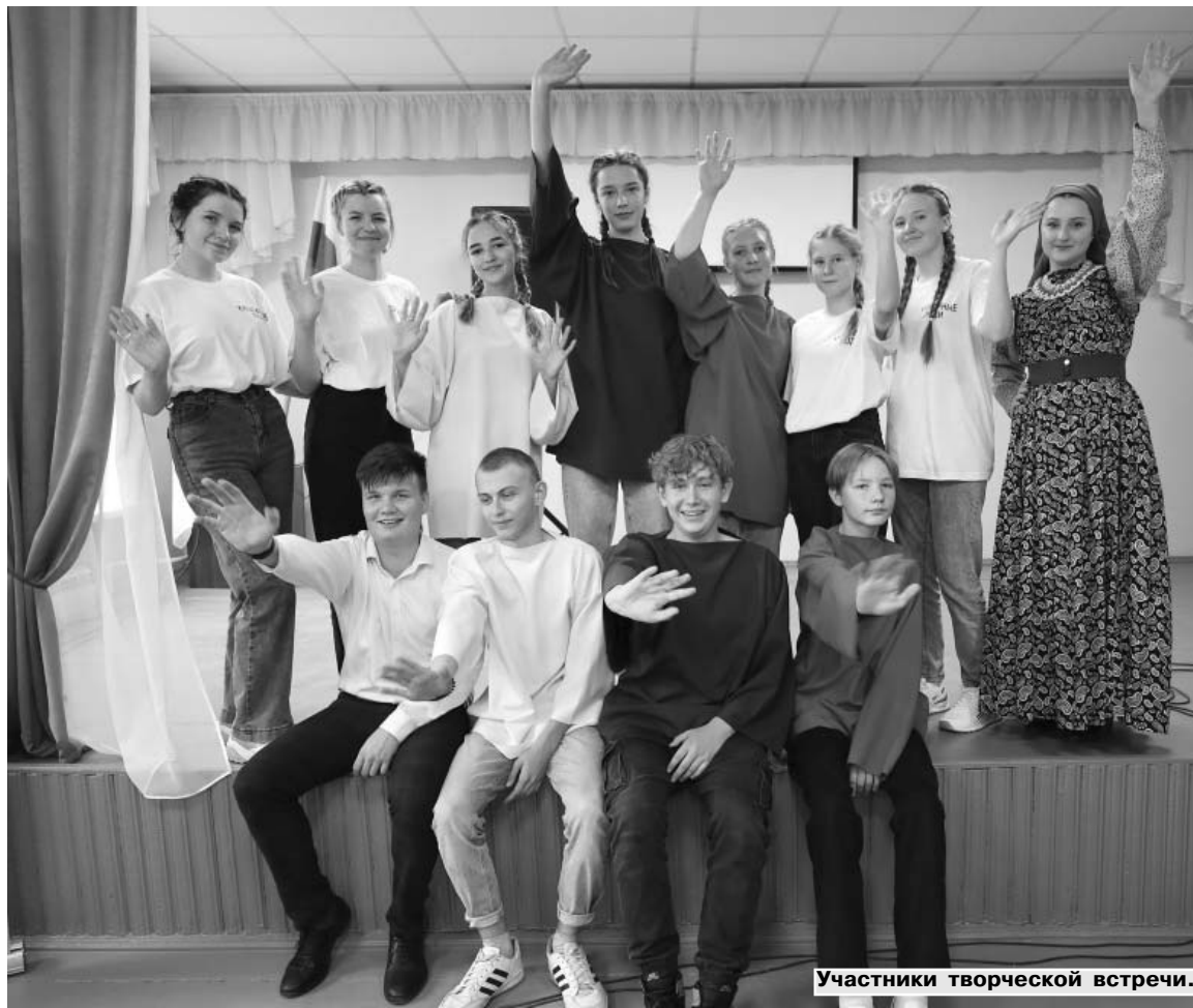
Участники творческой встречи.