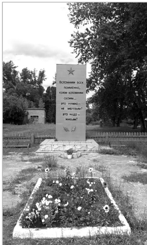
Памятник в Многоозерном планируется дополнить гранитными плитами с фамилиями погибших на войне жителей Южакова и ветеранов Великой Отечественной войны Южаковского сельсовета.

Во-первых, мы собираем информацию о фронтовиках, умерших в мирное время. Предварительный список ветеранов (а он, конечно же, есть) требует серьезных дополнений и уточнений. Необходимо составить наиболее полный список участников войны, жизнь которых тесно связана с Южаковым и Многоозерным (родились и выросли в селе Южаково и поселке Многоозерном, призывались отсюда или долгое время здесь жили и трудились, то есть о тех, чья судьба так или иначе с ними связана). Конечно, мы надеемся на помощь родных и близких ветеранов. Приглашаем наших земляков присоединиться к этому важному делу. Ознакомиться с перечнем фамилий