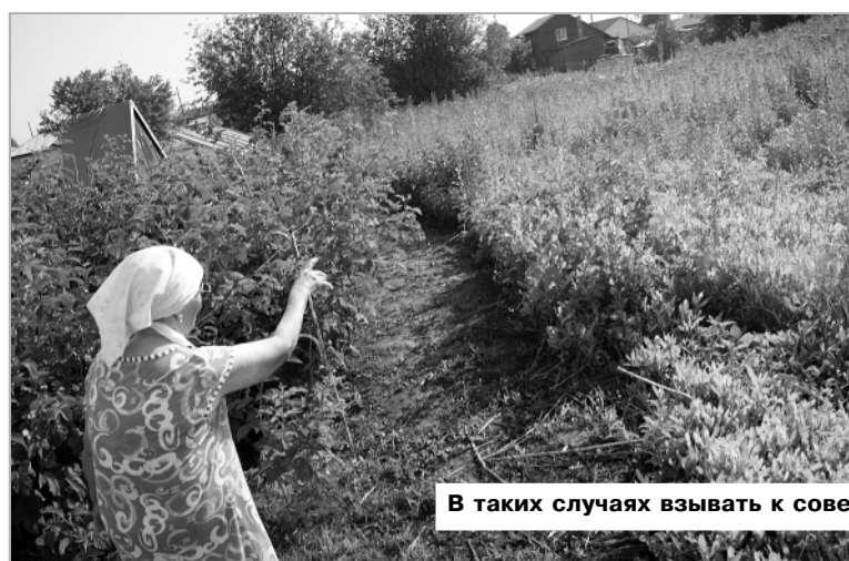
В таких случаях взывать к совести соседей, однако, безнадежно...

-Мне 88 лет, но я стараюсь содержать свою усадьбу в чистоте. Соседний дом постоянно сдают, там то живут, то не живут. Огород несколько лет не сажали. Он зарос бурьяном, семена сорняков да и они сами «лезут» на нашу терри-