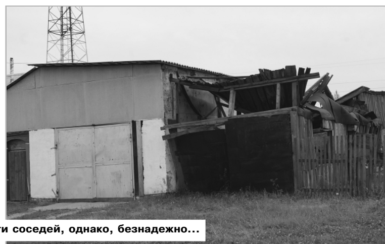
В таких случаях взывать к совести соседей, однако, безнадежно...

-Когда к нам поступают заявления от граждан в письменном виде, мы разбираемся. Выезжаем на участок, осматриваем территорию, разыскиваем владельцев. В этой работе мы руководствуемся п.2 статьи 20.4 КоАП «Нарушение требований пожарной безопасности»: нарушение требований пожарной безопасности в условиях особого противопожарного режима влечет наложение административного штрафа на граждан в размере от двух тысяч до четырех тысяч рублей, на должностных лиц – от пятнадцати тысяч до тридцати тысяч рублей, на лиц, осуществляющих предпринимательскую деятельность без образования юридичес-