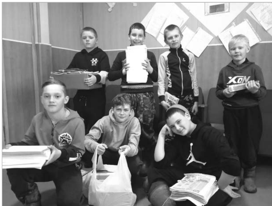
«Мы славно поработали!».

С 16 по 24 апреля в Загайновском доме досуга прошла акция по сбору макулатуры «Сдай макулатуру — спаси дерево!».