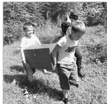
Не столь тяжелы найденные сокровища, сколько сам сундук. Но нести его – почетная миссия...

ребованными и нереализованными, хотя по природе каждый человек индивидуален и, без сомнения, в чем-то талантлив, – подчеркивает автор проекта. – Попадая в подобные села, мы чувствуем, что время здесь как будто остановилось. Но это далеко не так! Дом досуга села Озеро-Петровское пустым не бывает. В зале учреждения вершатся все важные дела села: проводятся праздники, сходы, собрания, вечера отдыха, концерты. Дом досуга – это единственное место в поселении, где можно развивать способности к творчеству. На его базе осуществляют деятельность семь клубных формирований: детский танцевальный кружок «Муравейник», детский кружок поделок из подручного материала «Непоседы», кружок по вязанию «Светлячок», вокальный кружок «Б.Э.М.С.», молодежный клуб «От скуки на все руки», детский волонтерский отряд «Солнышко» и спортивный кружок «Расту здоровым и сильным». Несмотря на неудобства и отсутствие условий для комфортной работы, услуги учреждения пользуются спросом, на проводимых мероприятиях всегда аншла!».