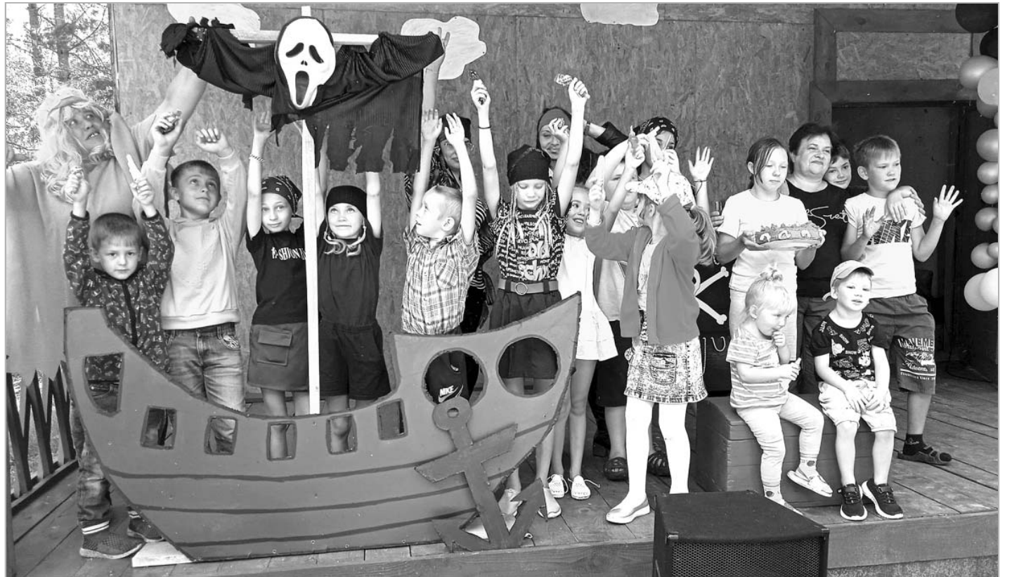
Благодаря победе в конкурсе социально значимых проектов на предоставление грантов Фонда Александра Прокопьева в Озеро-Петровском доме досуга появилась новая закрытая сцена, которая в минувший вторник превратилась в палубу пиратского корабля.

«Удаленность и недостаточное финансирование приводит к тому, что таланты остаются невос-