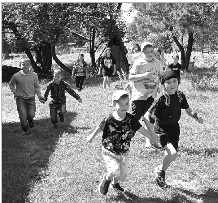
В поисках затерянных сокровищ ребятишкам пришлось не только проявить смекалку и ловкость, но и немало побегать, чтобы найти заветный клад.

– Они скоро вернуться, – заверила она, и мы отправились в помещение дома досуга, которое манило живительной прохладой, хотя и находится в стадии ремонта, чтобы подвести итоги всего увиденного. Как оказалось, подготовка к квесту заняла всего неделю, хотя мне казалось, что на такое грандиозное мероприятие должен был уйти как минимум месяц.