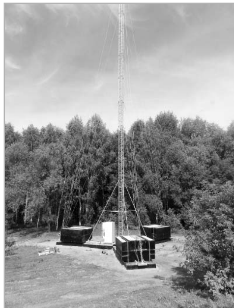
Устойчивую связь абонентам «Теле2» обеспечит эта станция.