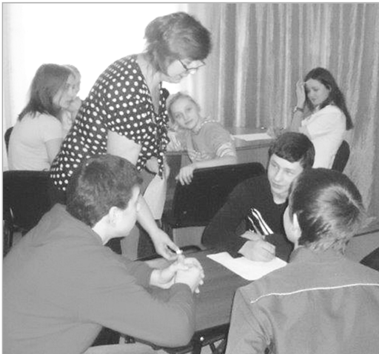
Специалисты Центра учат подростков быть ответственными и самостоятельными.

После нескольких занятий мы попросили подростков ответить на вопросы анкеты: «Нужно ли про-