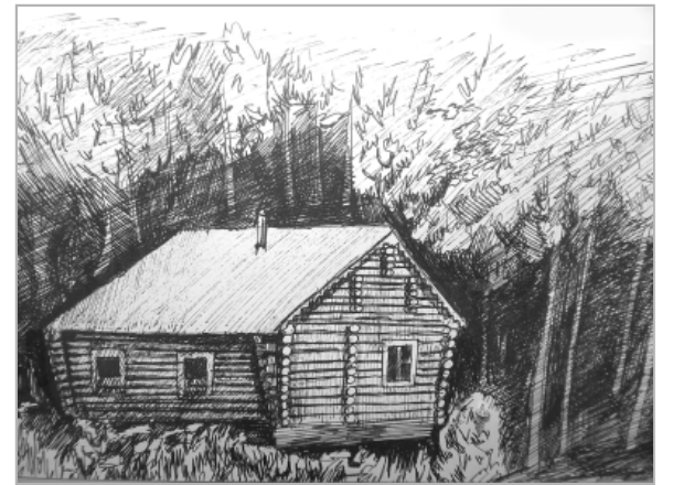
Среди представленных на выставке работ — «Снег», автопортрет в образе лета, «Домик в лесной глуши»...

демонстрировала полученные знания точно и ярко.