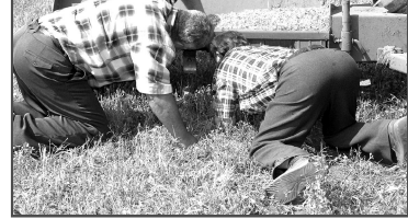
«Земной поклон» технике, которая еле «бегает». Но большего уважения, конечно же, заслуживают те, кто умудряется на ней пахать, сеять, убирать урожай.

Подготовила Наталья ТРОФИМОВА.