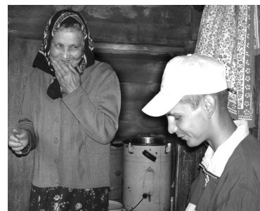
Кто-то готов поделиться с переписчиком и некими житейскими историями...

«Злоключения» продолжают. Минут двадцать простояв у калитки следующего дома, находим хозяйку во дворе. Одновременно видим высунувшуюся из приоткрытой двери голову хозяйки с бигуди. Здравомысляем и представляемся. Выражения лиц обоих владельцев дома меняются и становятся недовольными: