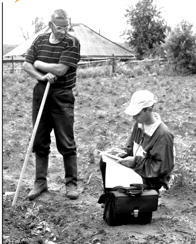
Удача, когда занятый на своей усадьбе хозяин с готовностью отвечает на вопросы переписчика!