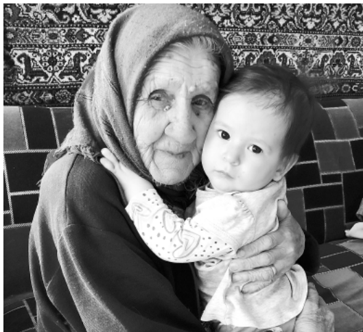
чтобы не болела и радовалась жизни. Сейчас ее окружают любящие дети, семь внуков, девять правнуков и один праправнук.

Я хочу, чтобы бабушка жила еще долго-долго,