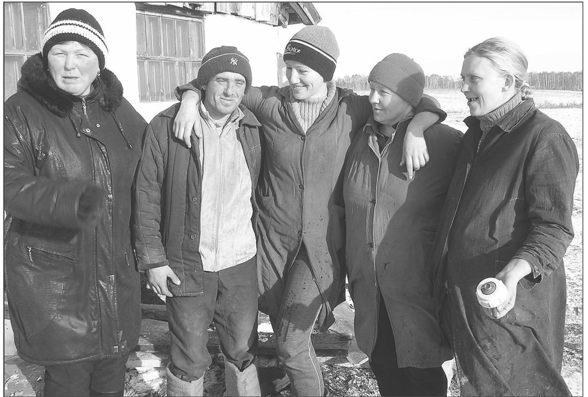
«Бригада» — это не название сериала, это сплоченный и очень дружный коллектив Песьянской фермы ООО «Петровский».

— В октябре из-за непогоды в селе три дня не было света, коро-