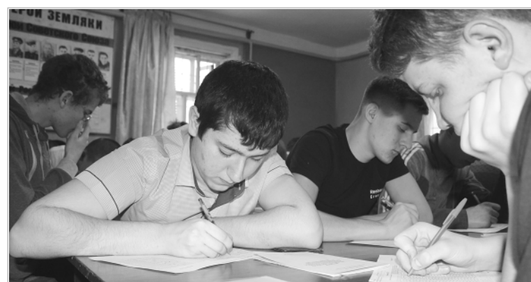
Тестирование — серьезный момент в определении будущего наших мальчишек. Именно на этом этапе выявляются их личные качества: способность быть лидером, способность мыслить, руководить подчиненными, склонность и пригодность к какой-либо воинской специальности.

Нашей армии нужны специалисты различного профиля, как с высшим, так и со средним специальным образованием. Воспитывать будущего защитника Родины нужно с детских лет, и в этом году мы раньше, чем обычно, начнем профессиональную ориентационную работу, с тем чтобы ребята, желающие поступить в военные учебные заведения, могли определиться с выбором специальности заранее. Есть кадетские корпуса, суворовские и нахимовские училища, есть учебные заведения для девочек, и