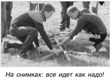
На снимках: все идет как надо!