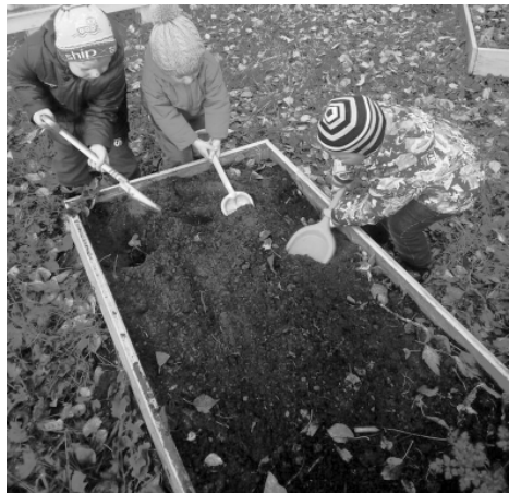
Можно с осени подготовить грядки, чтобы весной их только засеять.

Выкапываем остатки цветной, а затем, после Покрова, и поздней белокочанной капусты. После белокочанной начинаем уборку поздней брюссельской капусты. Чтобы лучше и дольше сохранить брюссельскую капусту, рекомендуют выкопать ее с корнями и прикопать в подвале в большой глубокий ящик во влажный песок или же подвесить корнями вверх на перекладину. Определив на хранение капусту, выкапываем все оставшиеся в земле кочерыжки с корнями. Не оставляйте в земле ни одного корня! На корнях капус-