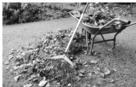
На зиму хорошо укрывать многолетние растения «перинкой» из опавших листьев.

Не храните лук вместе с картофелем — он быстрее испортится. В прохладном сухом месте с хорошей циркуляцией воздуха лук продержится 2-3 месяца.