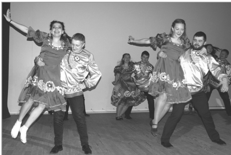
Концертная программа настолько обширна и разнообразна, что не оставляет равнодушным ни одного зрителя.

Концертные номера были замечательные, разноплановые – и проникновенные, посвященные Великой Отечественной войне, и шуточные. Песни, танцы, сценки, све-