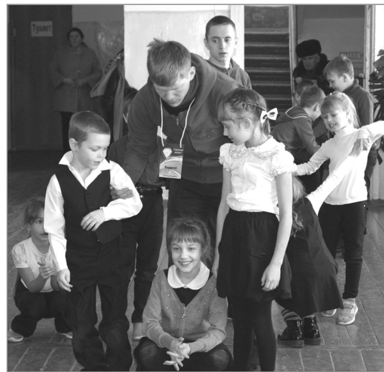
Ученики младших классов Беловской школы очень не хотели отпускать студентов и просили еще поиграть с ними.

вают увлекательные химические опыты, а для старшеклассников проводят профориентацию. Бойцы отряда, представители различных вузов Алтайского края, рассказывают об условиях поступления в свои учебные заведения, о том, какие существуют направления подготовки. Проводят лекции, посвященные профилактике наркомании и СПИДа, детского туберкулеза и пропаганде здорового образа жизни, а также по избирательному праву и молодежной политике в Алтайской крае.