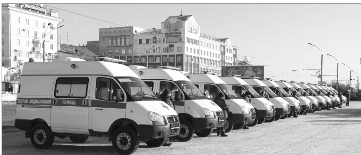
Прямоком с площади краевого центра один из этих автомобилей ушел в наш район.

30 января в краевой столице состоялось торжественное вручение автомобилей скорой медицинской помощи.