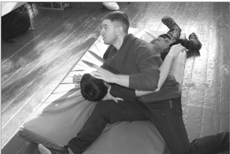
Самооборона – это серьезно! Мальчишки и девчонки с интересом смотрели, какие существуют приемы самообороны.

товое шоу, смешные КВНовские номера понравились зрителям.