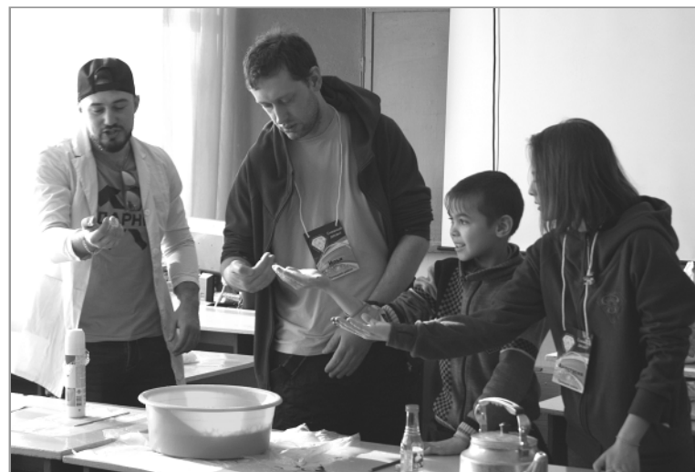
В увлекательных химических опытах, которые показывали бойцы «Снежного десанта», беловские школьники с удовольствием принимали участие.