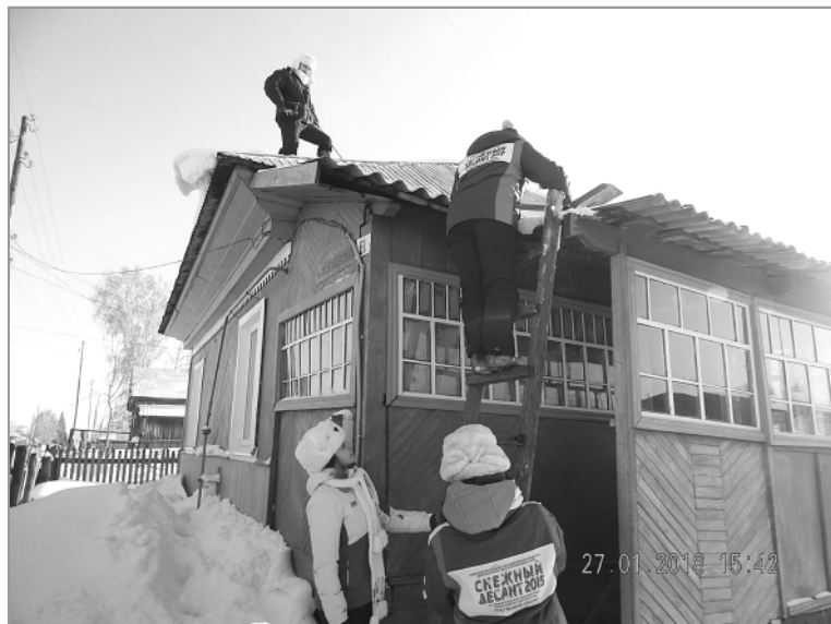
«Десантники» готовы к тому, что снег приходится убирать везде: и на усадьбах, и с крыш.

Жизнь бойца «Снежного десанта» насыщенная. День буквально расписан по минутам. В первой половине дня ребята ведут адресную помощь, а затем работают со школьниками. С ребятами младшего возраста проводят мастер-классы по прикладному творчеству, играют, разрисовывают щечки аквагримом. В среднем звене показы-