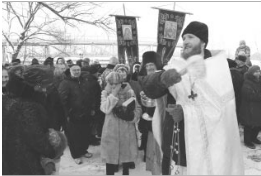
Чин великого освящения воды заканчивается окроплением всех присутствующих святой крещенской водой.

Крещение – один из наиболее важных праздников Православной Церкви, он приходится на 19 января. Согласно библейским писаниям именно в этот день крестился в водах Иордана Иисус Христос, а в момент Крещения на землю явился Бог Отец. Отсюда еще одно распространенное название праздника – Богоявление. Крещение завершает Рождественские святки, а накануне верующие встречают Новоевечерие, или Крещенский сочельник.