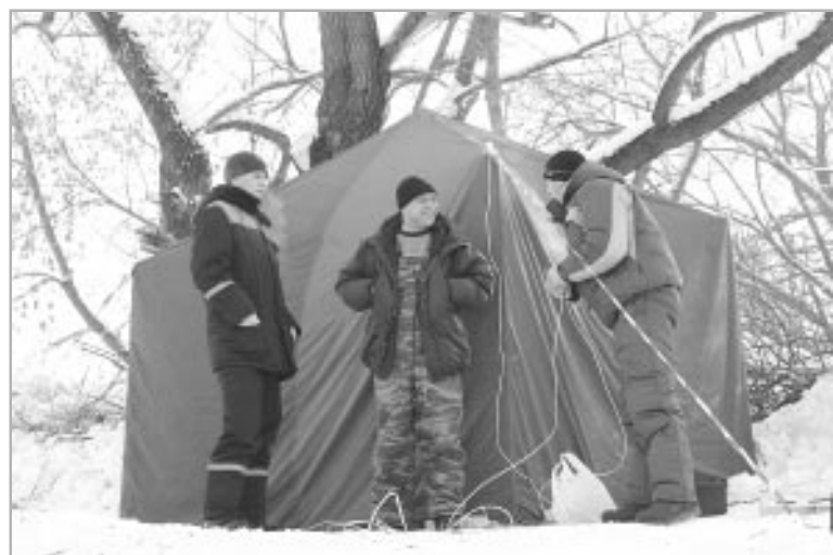
Для отдыха и обогрева купающихся на берегу была установлена палатка.