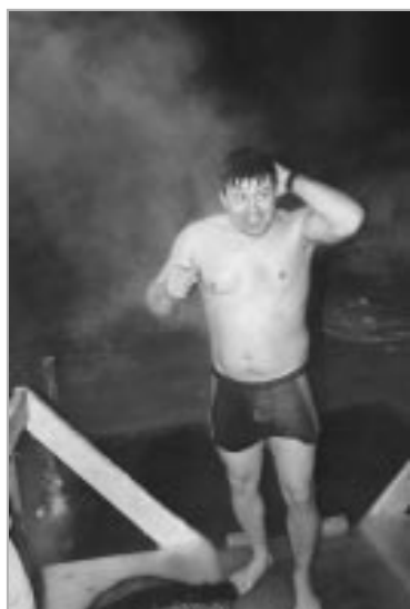
Считается, что крещенская вода целебна, и искупавшись в иорданы чувствует особый прилив сил и бодрости.