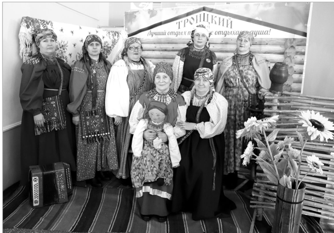
В числе хранителей народной культуры – воспитатели детского сада № 1 «Родничок».

Подготовила Елена ЦЫГЕЛЬНАЯ.