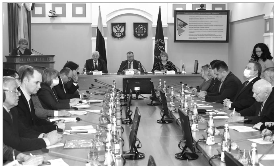
В работе комиссии приняли участие руководители органов исполнительной власти региона, сотрудники аппарата крайсовпрофа, председатели отраслевых организаций профсоюзов, а также представители федеральных ведомств, отвечающих за реализацию политики в сфере трудовых отношений.