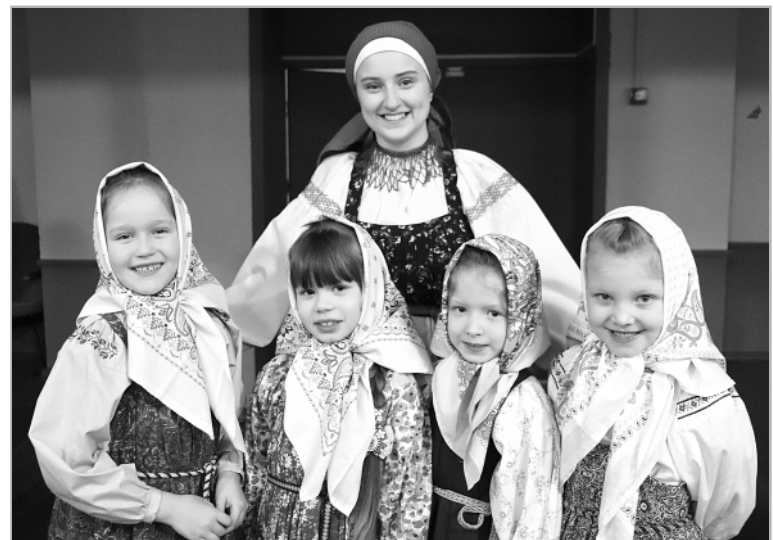
Вот такой он – детский фольклорный ансамбль «Заигрыш» (руководитель К. Казакова )!

Праздничная концертная программа, посвященная открытию Года культурного наследия народов России, носила название «Славится талантами родная сторона». Без сомнения, славится! В этом всякий раз убеждаются земляки, которые посещают концерты и фестивали. Так было и на этот раз.