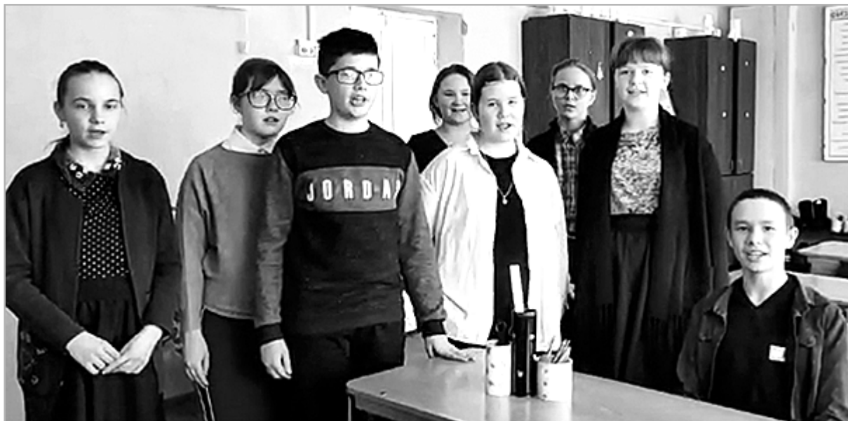
Семиклассники Беловской средней школы в стихотворной форме рассказали и наглядно показали, как из нескольких жестяных банок изготовить универсальный школьный органайзер.

«Это жесть!» – необычное для конкурса словосочетание, которое имеет однозначный смысл. Это конкурс видеороликов по вторичному использованию и утилизации металлических банок (консервные банки, банки из-под различных напитков и пр.). О том, как быстро, просто и красиво подготовить к сдаче в металлолом (сплющить) банку или что полезного можно из нее сделать, – темы конкурсных видеороликов.