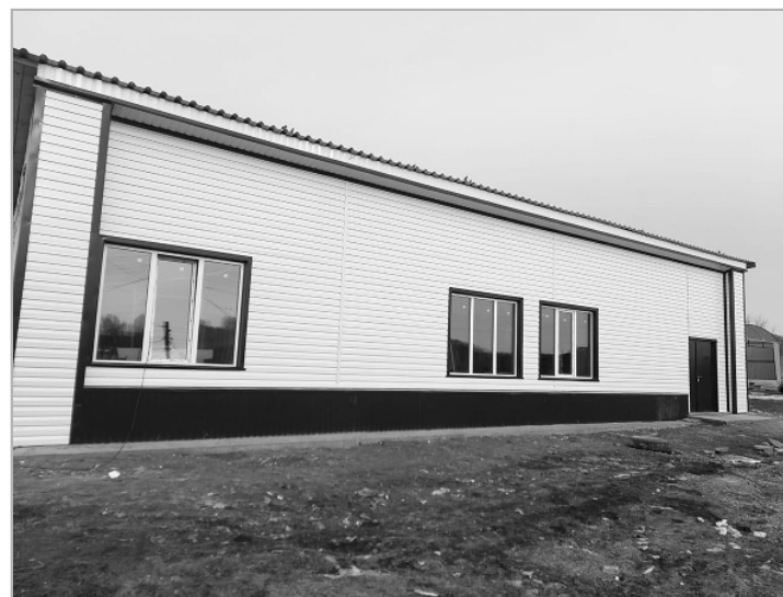
Разница налицо! Здание, в котором располагается Ельцовский Дом культуры, до и после участия жителей села в проекте поддержки местных инициатив.