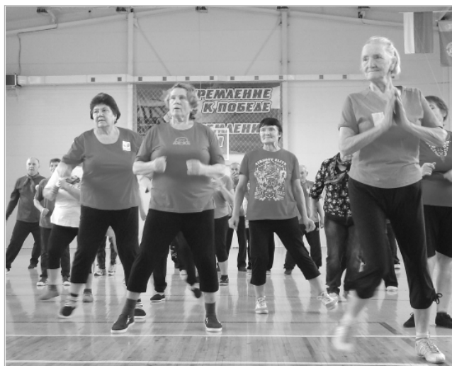
Одним из приоритетных направлений государственной политики является пропаганда здорового образа жизни, и кто, как не представители старшего поколения, могут стать примером для подражания?!

На четвертом этапе соревновались капитаны команд. Забросить мяч в баскетбольное кольцо — дело нелегкое. Но и капитаны, как говорится, не из тех, кто привык от-