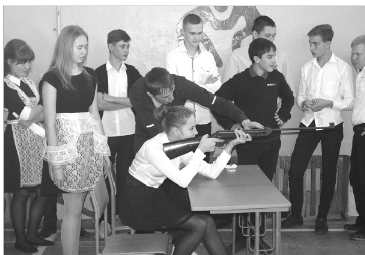
Пострелять из пневматической винтовки в этот день довелось даже девушкам.