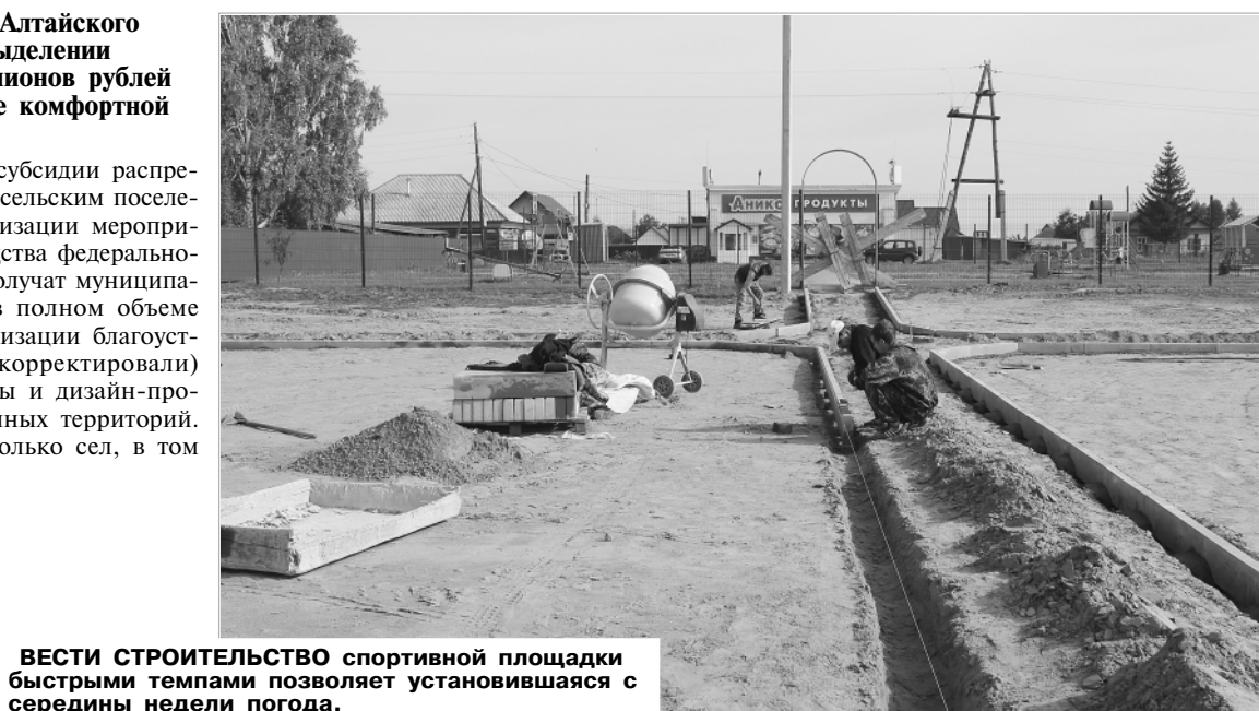
ВЕСТИ СТРОИТЕЛЬСТВО спортивной площадки быстрыми темпами позволяет установившаяся с середины недели погода.