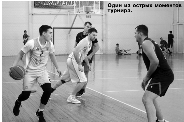
Один из острых моментов турнира.