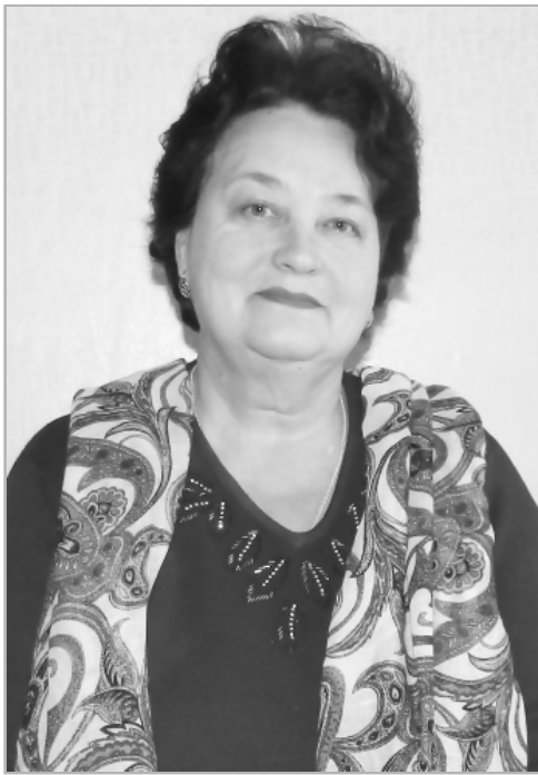
Многие исподволь готовятся к встрече Нового года...