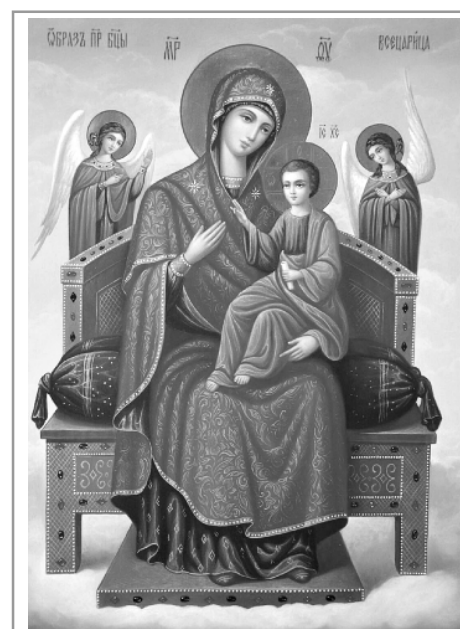
Молитва перед иконой Богородицы «Всецарица»

«О Всеблагая, досточудная Богородице, Пантанасса, Всецарице! Несмь достоин, да внидеши под кров мой! Но яко милостиваго Бога любоблагоутробная Мати, рци слово, да исцелится душа моя и укрепится немощствующее тело мое. Имаши бо державу непобедимую, и не изнеможеш у Тебе всяк глагол, о Всецарице! Ты за мя упроси! Ты за мя умоли. Да прославляю преславное имя Твое всегда, ныне и в безконечныя веки. Аминь».