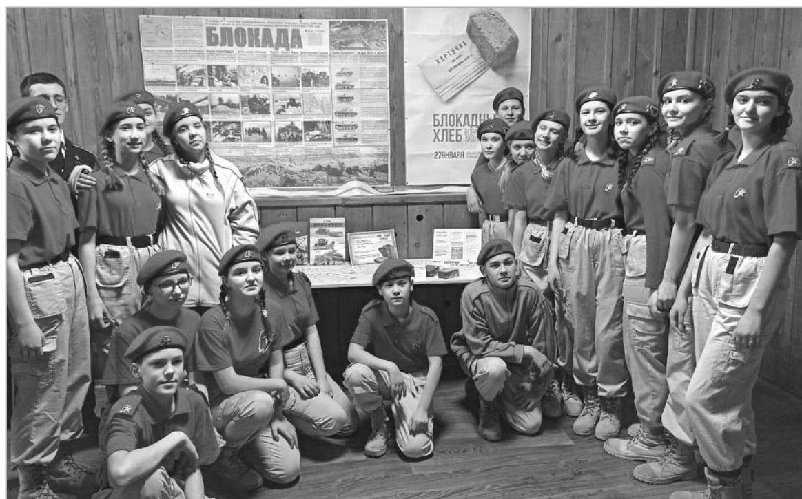
Ребята из краевого юнармейского отряда «Атаман» (г. Бийск) приняли активное участие в мероприятиях, посвященных 80-летию полного освобождения Ленинграда от фашистской блокады.

Светлана КУДИНОВА.