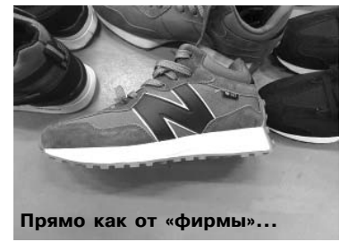
Прямо как от «фирмы»...