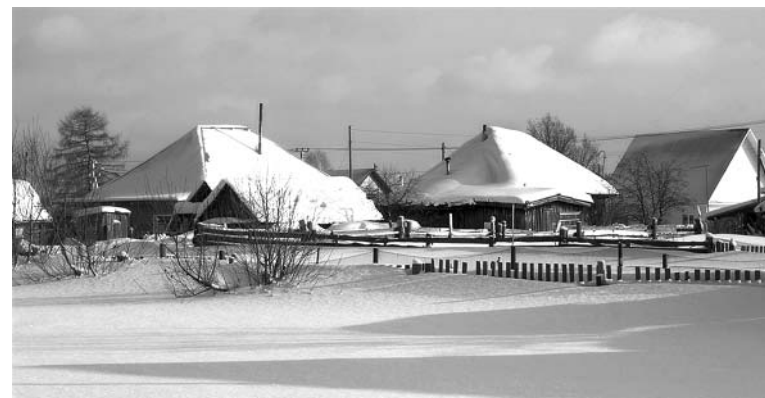
Дома ждали родные...

И тут впереди показались четыре огня. Вернее, четыре круглых желтых пятна. Но сомнений не было — фары. Фары! Не машины, нет, это явно были фары К-700. Двух тракторов. Они шли параллельно, один чуть позади другого. Их ковши легко счищали заносы, выравнивая дорогу. И хотя мы этого не могли видеть за белой плотной завесой метели, мы это ощущали, понимали. «Касемсоты» приближались, автобус тоже