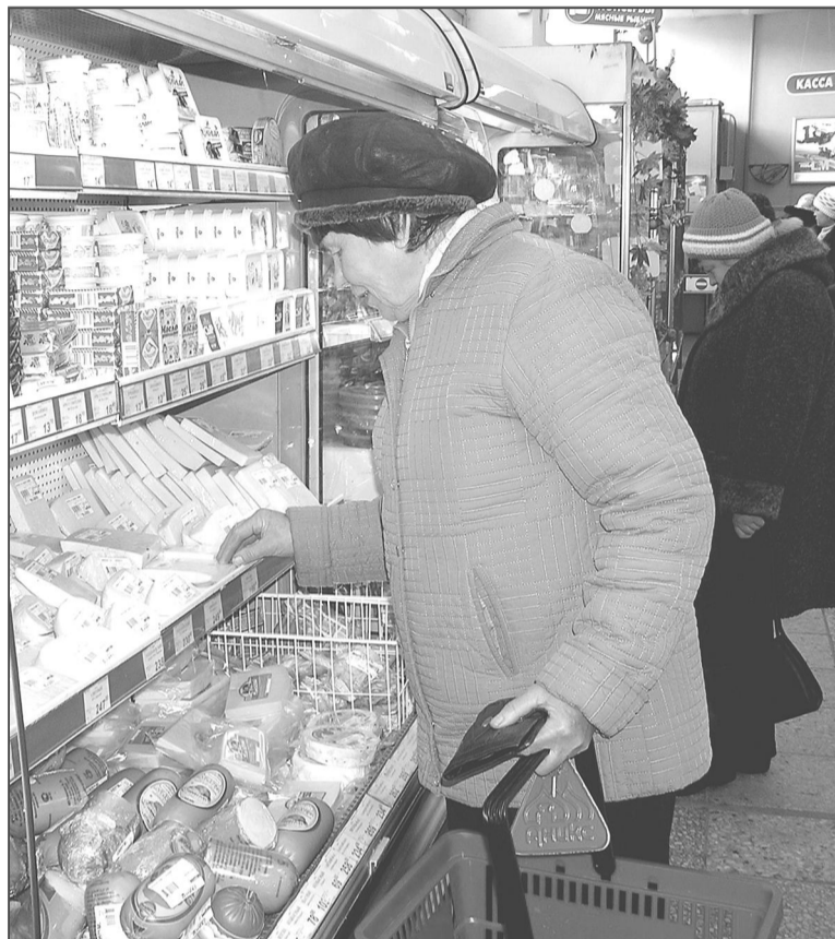
Цены на молочные продукты «кусаются». И прежде чем положить сыр или масло в корзину, приходится прикинуть, насколько пострадает семейный бюджет от покупки.