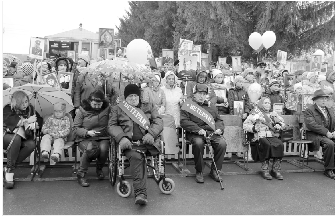
9 Мая на праздничном митинге в райцентре почетные места традиционно занимают ветераны Великой Отечественной войны и труженики тыла.

В нашем регионе живет более 19 тысяч ветеранов Великой Отечественной войны. Из них непосредственных участников и инвалидов Великой Отечественной войны — 920, 5246 вдов (вдовцов) погибших или умерших участников войны, 216 — награжденных знаком «Жителю блокадного Ленинграда», 288 бывших несовершеннолетних узников фашизма, 15942 труженика тыла.