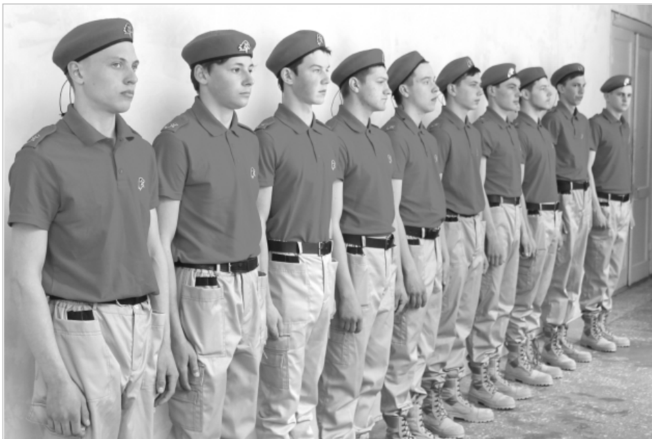
Молодежный отряд Алтайского агротехнического техникума перед поездкой в Бийск на торжественное мероприятие в Единый день «Юнармии». 27 апреля студенты были приняты в ряды патриотического движения.

До принятия присяги перед ребятами выступили представители творческих коллек-