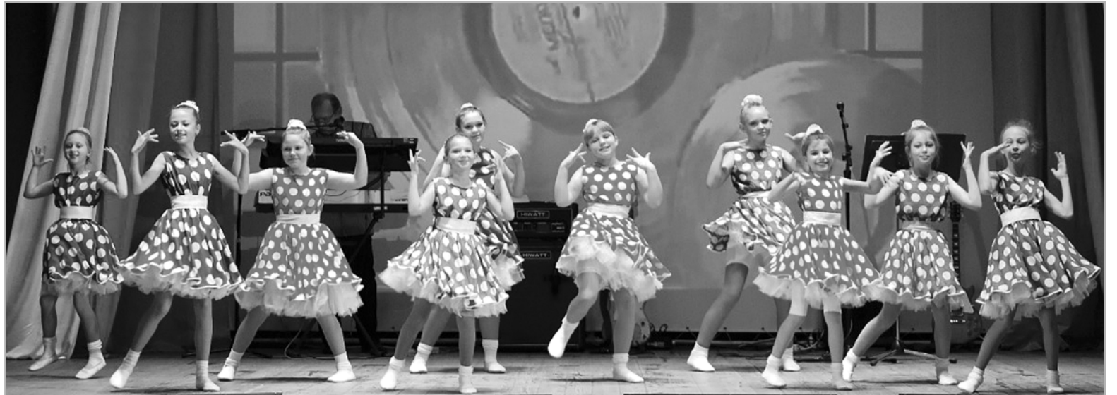
Выступления танцевального коллектива «Модерн» всегда трогательны и эмоциональны.

В концертной программе с яркими номерами выступили танцевальный коллектив «Модерн» (ру-