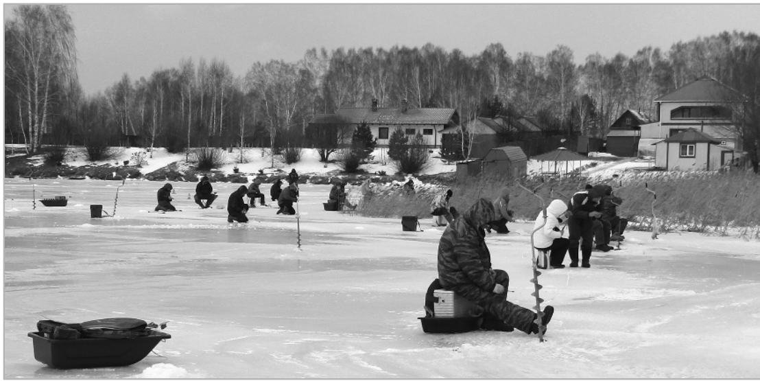
Уткуль: места хватает всем!

Два часа первого тура пролетели незаметно, практически все добыли улов. Конечно, вес и количество были разные, но на то они и состязания. В перерыве обедали и грелись на базе отдыха. За чаем и бутербродами было весело, вспоминали интересные случаи и тра-